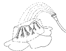
Figure 3 - Demonstration of soil erosion.