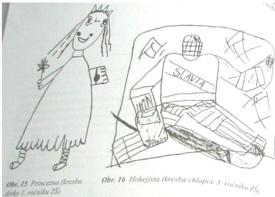
Obr. 15 Princezna (kresba dívky 1. ročníku ZŠ)

Identifikační vzory, které si děti zvolily za námět svých kreseb, vypovídají též o rozdílných aspektech dívčí a chlapecké identity. Nejčastějším motivem děvčátek prvního ročníku je postava princezny. U chlapců se pohádkové motivy objevovaly zcela výjimečně, o jejich ideálním vzoru zřejmě svědčí četné kresby hokejistů a policistů. Zatímco dívčí ztvárnění postav princezen nejspíše poukazuje z hlediska genderové identity na přijetí ideálu ženského půvabu, v případě motivů chlapeckých kreseb sportovců možno usuzovat na identifikaci s prvky mužského hrdinství a obdivuhodného výkonu.