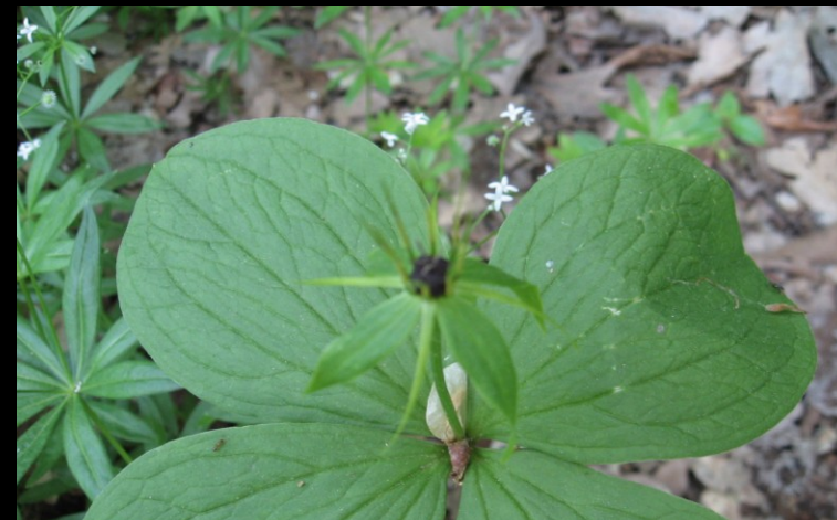
vraní oko čtyřlisté