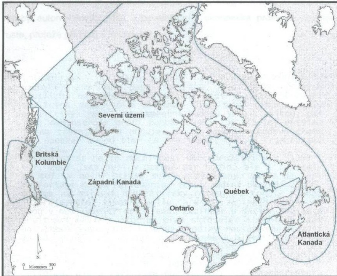
Obr. 21. Šest geografických regionů Kanady (upraveno podle Bone M., R. (2000): The Regional Geography of Canada , s. 9)