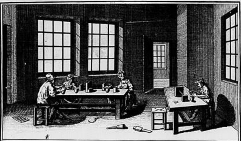
Passenterie, détails des Outils propres à faire la Nonpareille.