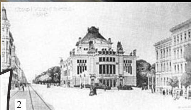
Návrh ze soutěže z roku 1907