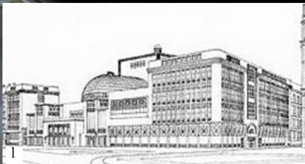
Návrh ze soutěže z roku 1910