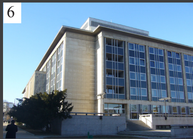
Pohled na divadlo z Jezuitské ulice