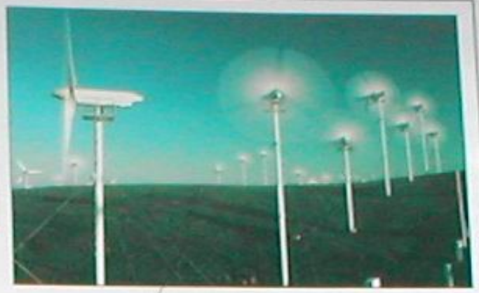
Wind power is increasingly being used to harness the energy of the atmosphere. These windmills in Altamont, California, each have a three-bladed propeller.