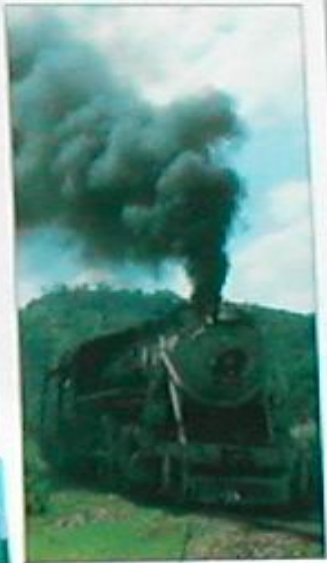
The steam engine illustrates how heat energy can be converted into movement. Coal is burned to heat up water and produce steam, which drives pistons to turn the wheels.