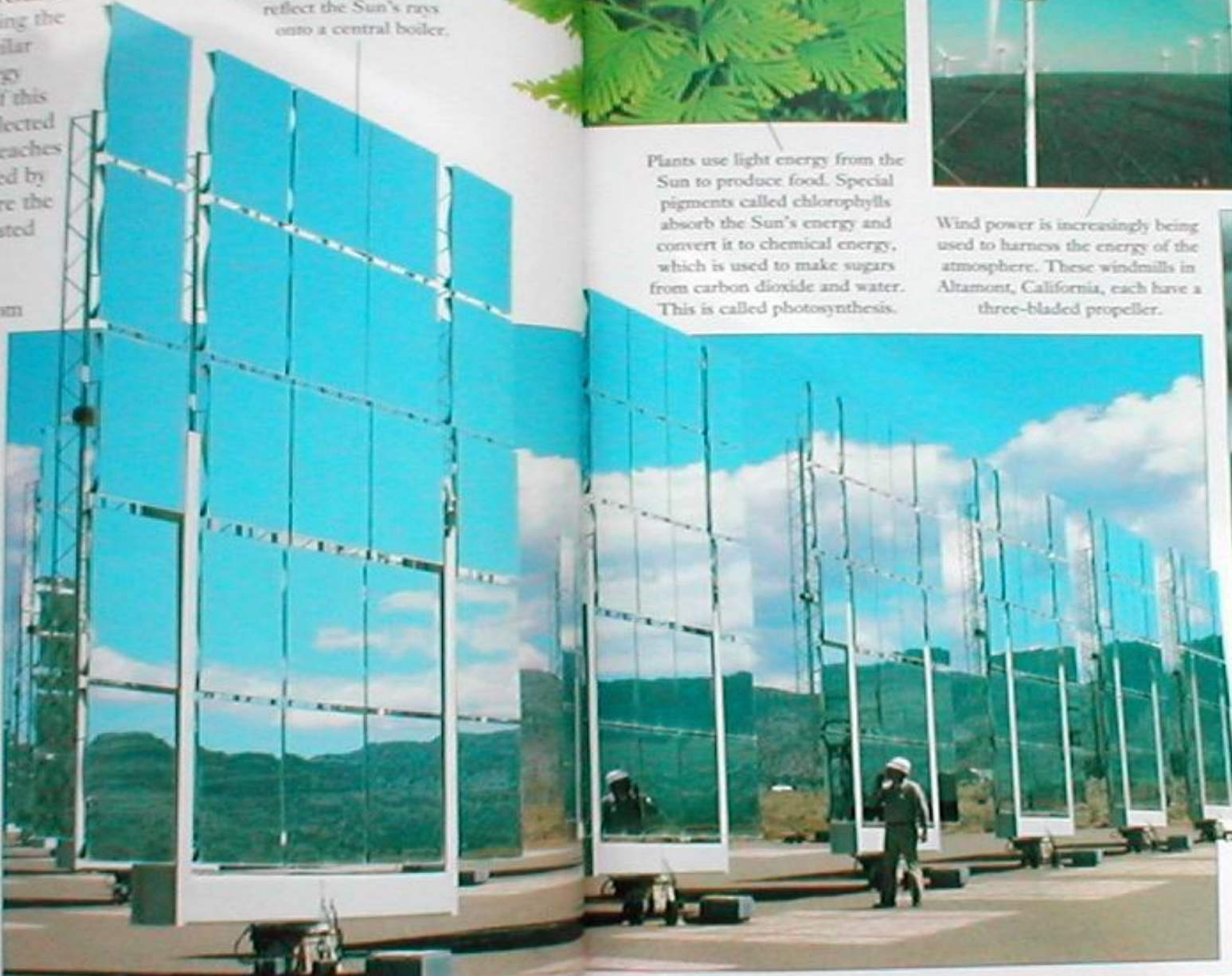
This solar power station uses the Sun's energy to provide electricity. Large mirrors reflect the Sun's rays onto a central boiler.

ment, or is released iving the milar ergy of this ected reaches ned by ere the eated from