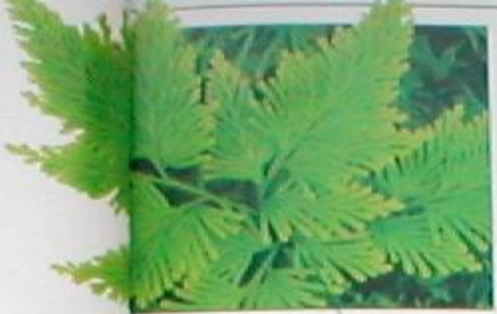
Plants use light energy from the Sun to produce food. Special pigments called chlorophylls absorb the Sun's energy and convert it to chemical energy, which is used to make sugars from carbon dioxide and water. This is called photosynthesis.