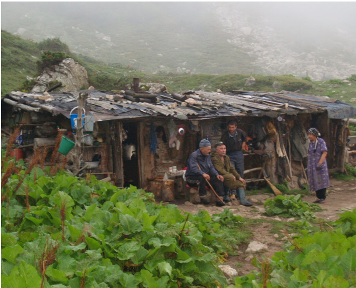
Obr. vlevo + Kyrgystán