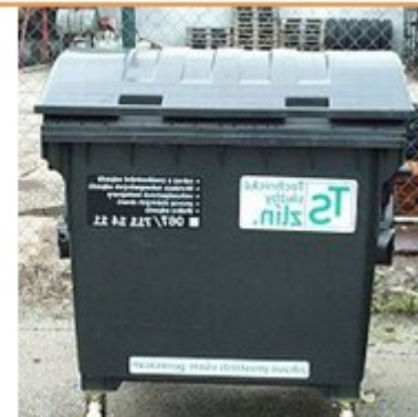
SMĚSNÝ KOMUNÁLNÍ ODPAD