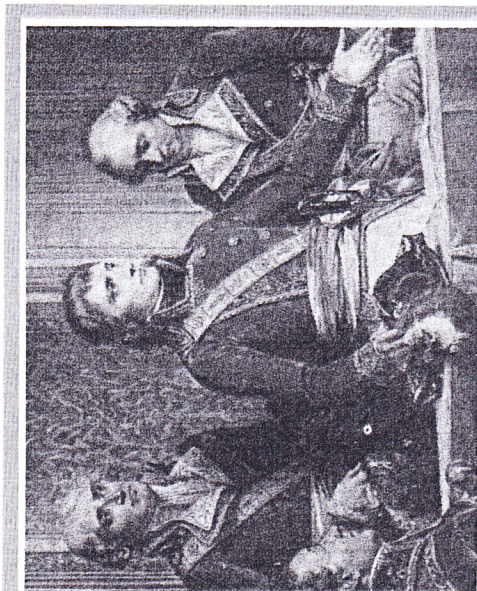
Les trois consuls (à droite : Cambacérès, au centre : Talleyrand, à gauche : Bonaparte).

Bonaparte est désormais l'empereur Napoléon I er . Il n'a que 35 ans et gouverne pratiquement seul, ayant supprimé le Tribunal en 1807 et réduit l'importance des assemblées. La liberté de presse est limitée, la police renforcée. Aux frontières il doit de nouveau faire face à l'Angleterre, à la Russie, à la Suède et à l'Autriche. Malgré la défaite de la flotte française à Trafalgar en 1805, les armées de l'empereur finissent par imposer la paix à tous les pays voisins. C'est une période de victoires successives : Napoléon bat les Russes et les Autrichiens à Austerlitz en 1805, les Prussiens à Jéna en 1806, les Russes à Friedland en 1807, tente d'organiser un blocus contre l'Angleterre qui domine sur mer (décret de Berlin). L'application du blocus le mène à une désastreuse guerre d'Espagne qui durera jusqu'à la fin de l'Empire, à une opposition avec le Pape qu'il enlève de Rome et fit prisonnier. Profitant de la guerre d'Espagne les Autrichiens menacent de nouveau la France et furent battus à Wagram en 1809. C'est l'apogée pour Napoléon I er et pour la France. La paix semble revenue. L'empereur gouverne directement par l'intermédiaire des membres de sa famille près de la moitié de l'Europe.