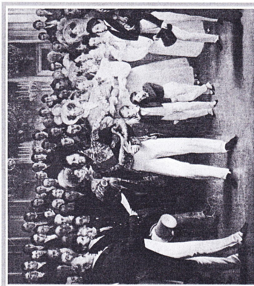
La Chambre des Députés présente au duc d'Orléans l'acte qui l'appelle au trône et la Charte de 1830.

Louis Philippe fit voter plusieurs lois importantes, sur l'enseignement primaire, le développement des transports par chemin de fer, l'ouverture d'écoles libres. Affaires, commerce et industrie étaient prospères. A l'extérieur la France alliée à l'Angleterre aide la Belgique à devenir indépendante de la Hollande (1831) et débute la conquête de l'Algérie ébauchée sous Charles X (prise d'Alger). Les Français s'emparent de Constantine de 1848.