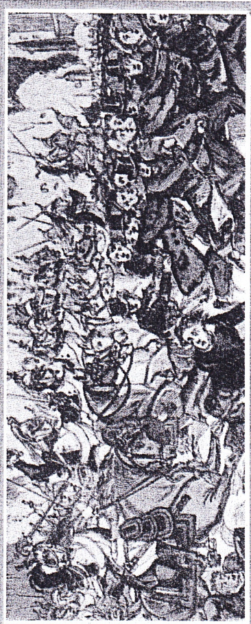
Fig. 15. Le 15 mai 1848, les insurgés de Paris se battent pour la Seconde République.

Le 7 novembre 1852 le rétablissement de l'Empire est proposé. Il sera largement approuvé par les Français le 12 novembre 1852.