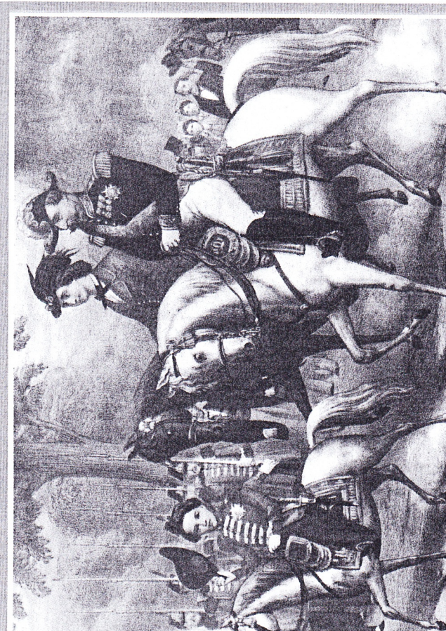
Napoléon III avec son épouse Eugénie et leur fils.

La IIIe République est proclamée à Paris. Napoléon III est déchu le 4 septembre 1870. Les députés forment un gouvernement de la défense nationale et refusent de capituler. Ce gouvernement émigre à Tours, Gambetta organise la résistance en province. Paris est pris. Gambetta réorganise l'armée en trois corps : armée du nord dirigée par Faidherbe, armée de la Loire (Chanzy) et armée de l'est (Bourbaki). Les français sont battus. Un armistice est signé. La paix est signée le 10 mai 1871. La France perd l'Alsace, le nord de la Lorraine, paie 5 milliards de francs à la Prusse.