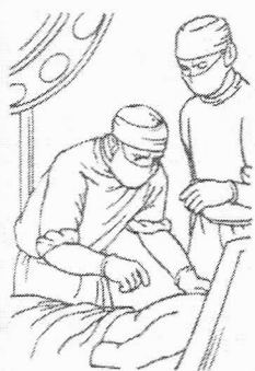
• Хирург — ...