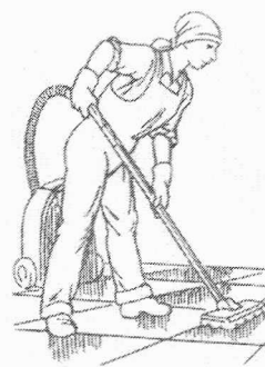
• Уборщица — ...