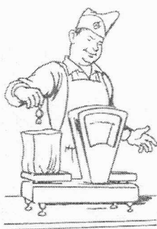
• Продавец — ...