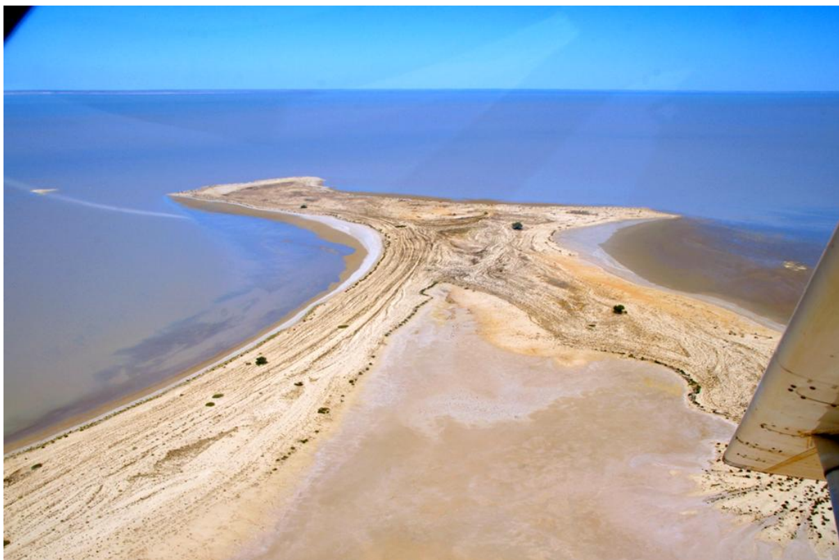
Obr. Hd_57. Opadávající hladina Eyreova jezera dne 1. 10. 2011.

V r. 2011 začalo Eyreovo jezero „na jaře“ (v listopadu) vysychat, hladina vody byla již jen na 35 % celkové plochy a 2. 1. 2012 již byly zbytky vody jen v nejnižší položených částech dna u jižního okraje severního jezera (max. 40 cm). Řeky se změnilly v řady dlouhých tůní (waterholes) a tracky přes koryta řek byly postupně otvírány. Ovšem v prosinci 2011 opět spadly značné srážky na horních tocích řek, tak je možné, že vlhká perioda ještě bude pokračovat. Každopádně opakující se velké povodně od r. 2008 a zaplavení Eyreova jezera po většinu roků 2009, 2010 i 2011 vedlo k rozvoji zde nebývalých rekreačních aktivit – splouvání řek na lodích, pozorování ptáků na jezeře, četným letům letadel s turisty nad celou oblastí a dokonce k závodu katamaránů z Bidrsville po rozvodněném Warburton Creek (River) zaplavenými háji cca 350 km do Eyreova jezera. Ne příliš technicky kvalitní video ze závodu je zde: