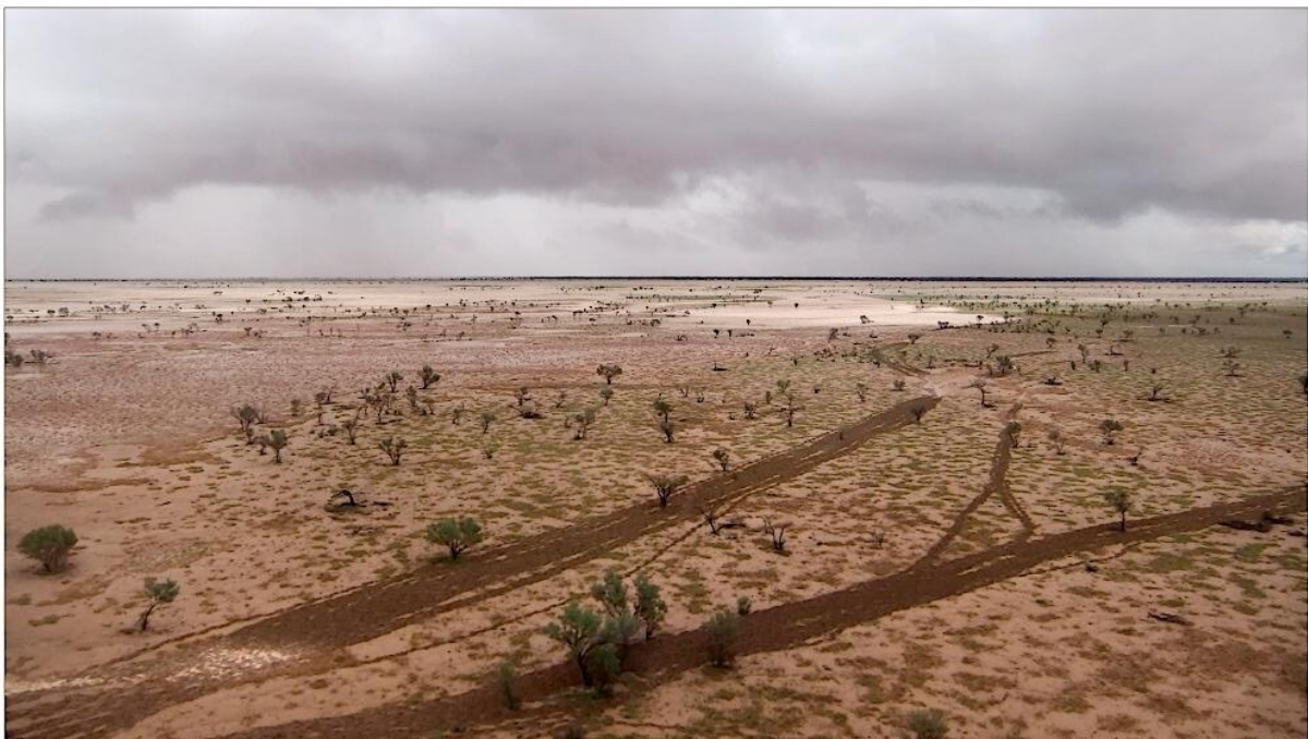
Obr. Hd_54. Cooper Creek na středním toku při opadávající povodni. Stav dne 4. 3. 2010.

Nedávné klimatologické studie ukázaly, že výrazně vlhké periody v povodí Eyreova jezera těsně souvisí s pozitivní fází ENSO – La Niña. Z vývoje ročních průtoků je však zřejmé, že cykly maxim bývají dlouhé 7 - 10 let, trvání minim je o něco kratší. Zdá se, že současná vlhká perioda začala nezřetelně po r. 2002. Velké občasně řeky přitékající od S a SV se rozvodňovaly v l. 2003, 2004 a 2008, ale vpád vody do jezera znamenaly až povodně rozvíjející se v horních částech povodí od poč. ledna 2009 (podobné obr. Hd_54). V květnu 2009 pak začaly první řeky plnit jezero (viz obr. Hd_55). Byla to událost dvacetiletí, takže se stala předmětem hlavních zpráv a mimořádného zájmu turistů, kteří týden putovali po prašných nebo rozbahněných píštách k jezeru. V srpnu 2009 bylo Eyreovo jezero víceméně zaplaveno. Do ledna 2010 však voda v jezeře vyschla. Jenže již od listopadu 2009 střídavě, ale postupně stále intenzivněji přšelo v severní části povodí a docházelo k tvorbě další povodňové vlny. Ta byla podstatně delší než předchozí, takže do jezera dotekly všechny řeky, tentokrát i vč. Cooper Creek. Jezero se téměř naplnilo. Povodně v r. 2011 byly větší, ale kupodivu hladina v Eyreově jezeře nedosáhla stavu r. 2010. Přívoz přes Cooper Creek, který dříve býval v provozu výjimečně, se stal stálým zařízením, které nahrazuje zatopené cesty. Viz obr. Hd_56. Pozoruhodný vývoj plnění Eyreova jezera v r. 2010 je v boxu Hd_4.