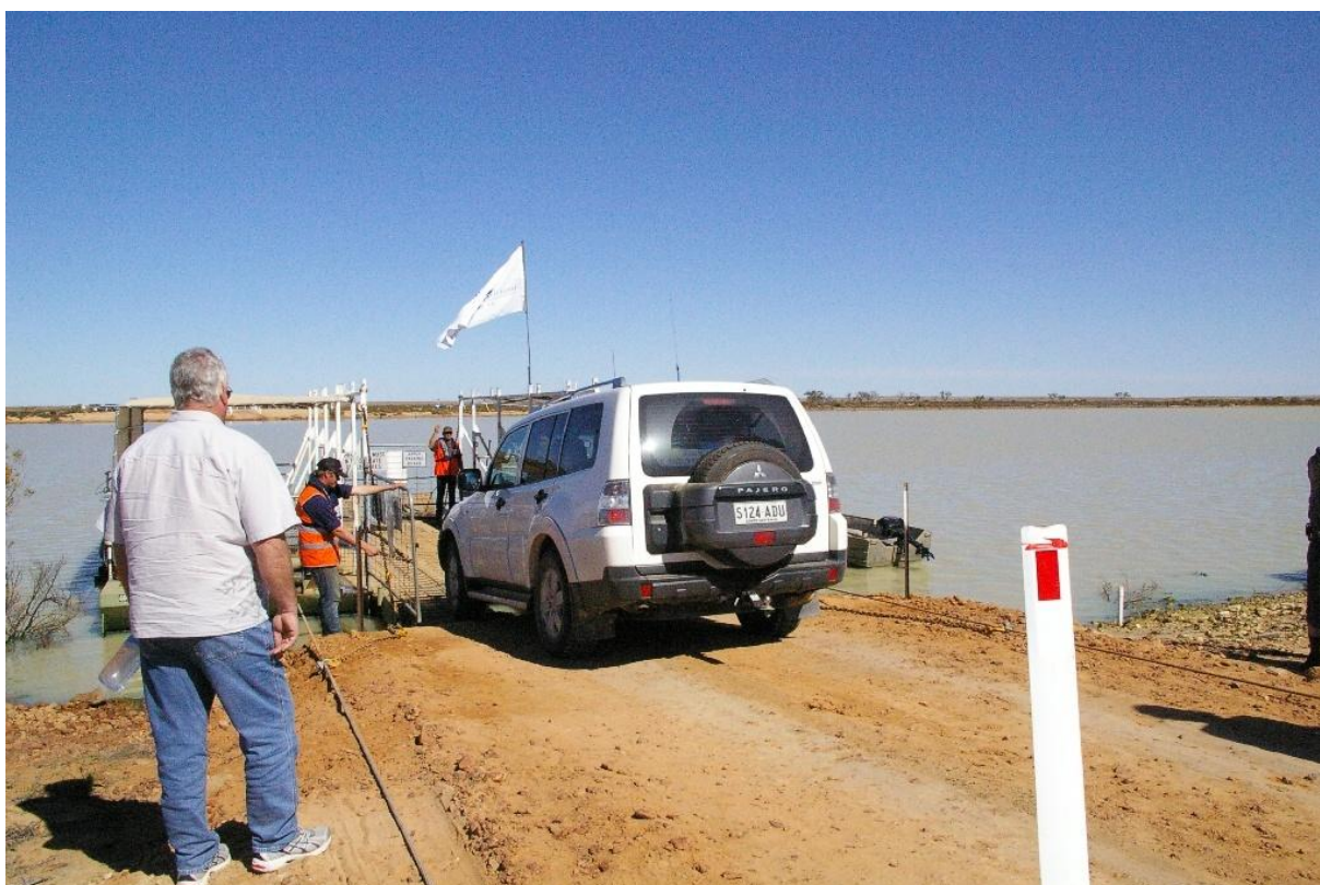
Obr. Hd_56. Přívoz přes střední tok rozvodněného Cooper Creek. Dne 21. 8. 2010.