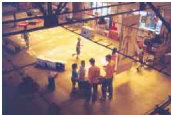
Týden dětské tvořivosti 97 (JUNIOR – DDM)

V r.1996 jsme uzavřeli písemnou smlouvu s vedením státního podniku Zetor, že můžeme uspořádat přímo v areálu Vaňkovky velkou kulturní akci – „Pro Vaňkovku“, na kterou se přišlo podívat více než 1000 lidí. Byl to úžasný zážitek, slavné zmrtvýchvstání! Město organizaci akce podporovalo a částečně ji spolufinancovalo. Zbytek dodal nebo dotoval soukromý sektor – stavební firma sídlící v sousedství pomohla upravit terén a půjčila elektrický kabel, pivovar Starobruno dodal sponzorsky pár soudků piva, atd... Velmi nám také pomohlo ocenění v soutěži o cenu Místa v srdci, které jsme získali koncem r.1996. Dodalo nám to další odvahy a chuť do práce a také z našeho hlediska veledůležitou finanční odměnu 100 000 Kč. Ta nám pak umožnila zprovoznit část prostorů v budově Modelárny před další sezónou. Odborníci ze Zetoru, kteří Vaňkovku důvěrně znali, nám na základě smlouvy provedli