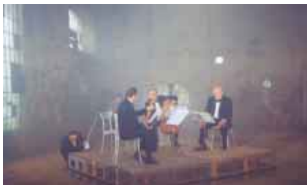
ČT Brno natáčí v Jádrovně