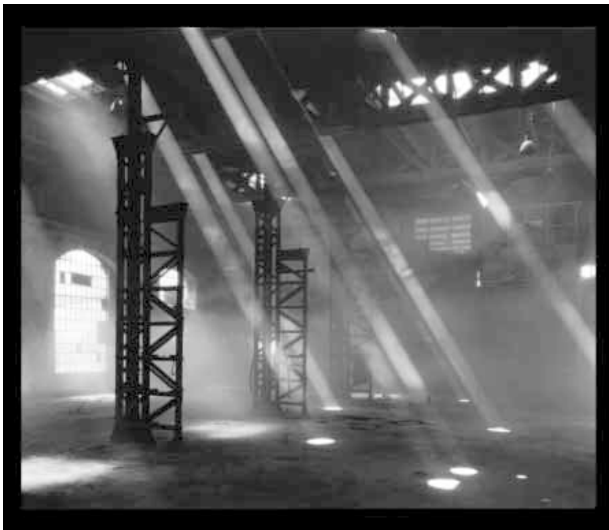
Světla v jádrovně

V této příloze demonstrujeme, jak důležitou tvořivou a vizionářskou roli představuje občanská iniciativa a neziskový sektor právě v procesu regenerace místních brownfields. Příloha je prezentována Občanským sdružením Vaňkovka, které se po dobu 10 let angažovalo ve znovuvyužití tohoto areálu. Příběh dokazuje, že znovuvyužití brownfields je běh na dlouhou trať, plný zvrátů a nutných kompromisů.