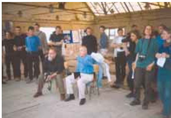
Mezinárodní studentský workshop 1999

Nakonec ale vše dopadlo jinak: Aktivity našeho sdružení Vaňkovku nejen zdokumentovaly a zviditelnily, ale pomohly jí také vyřešit složitý vlastnický problém. Naši činnosti se zvýšil společenský potenciál a tím i komerční