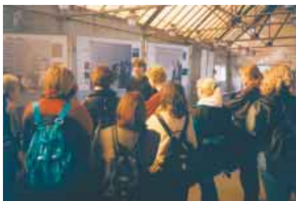
Anna Franková – odkaz pro současnost