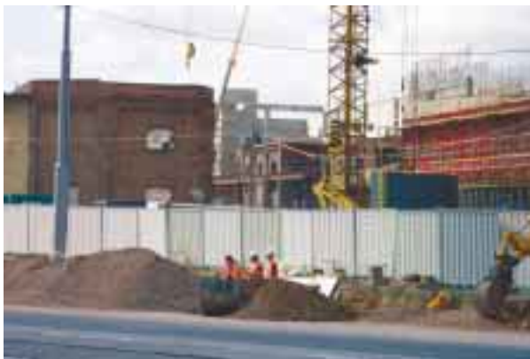
Stavba nákupní Galerie Vaňkovka