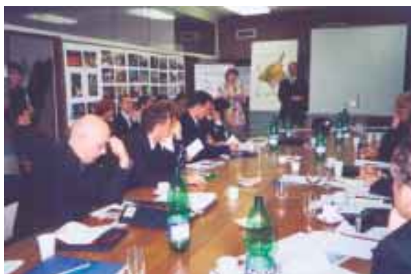
Experti, město a ECE – listopad 2001