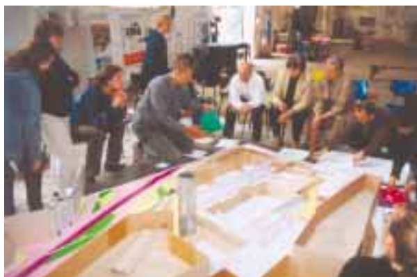
Plánovací víkend 2001