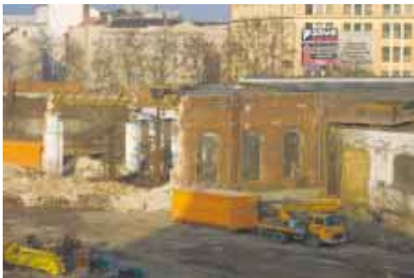
Bourání části jádrovny