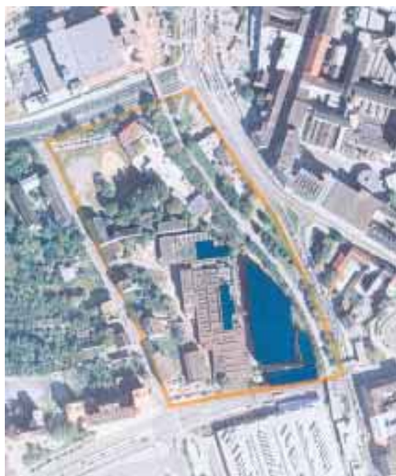
Modře – zachovaná část areálu

Vaňkovka přináší do 21. století poselství tvořivosti a lidské spolupráce. Právě tyto vlastnosti nám pomohou uspět v konkurenci EU. Širším cílem našeho záměru je ovlivnit také využití nyní městského majetku – zrekonstruované Strojírny – pro veřejné účely. Považujeme za optimální realizovat v tomto objektu centrum interaktivního vzdělávání mládeže, které pracovně nazýváme Studio Vaňkovka. Je to rozsáhlý projekt uskutečnitelný pouze na základě širokého partnerství a s pomocí strukturálních fondů EU. Na přípravě tohoto projektu spolupracujeme s JUNIOREM – Domem dětí a mládeže za morální i finanční podpory Jihomoravského kraje již déle než dva roky. Projekt tohoto druhu však potřebuje spolupráci a podporu mnoha institucí včetně zastupitelstva Statutárního města Brna. Součástí našeho záměru, který jsme předložili JCB a.s. je proto návrh založení nového právního subjektu, který bude schopen řídit další přípravu projektu a posléze jeho provoz.