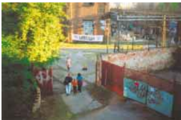
Dny evropského dědictví 2002