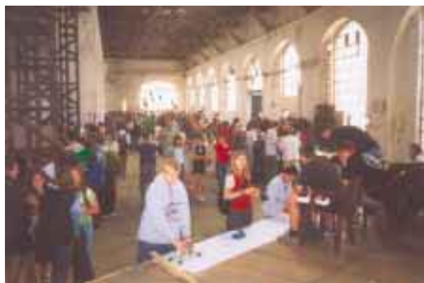
Heuréka 2002 – vědecká herna v Jádrovně