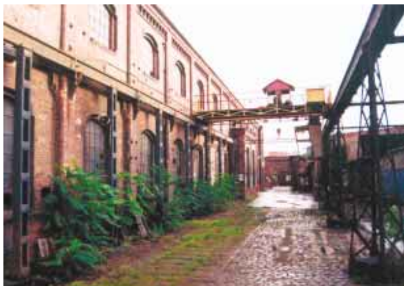
Strojírna a prostor pod jeřábovou dráhou

Rozhodli jsme se proto založit nadaci. V té době to byla nejjednodušší forma sdružení občanů. Cílem nadace byla zejména podpora záměru rekonstrukce a oživení areálu Vaňkovka v Brně pro obchodní, kulturní a vzdělávací účely. Naším vkladem do nadace bylo v počátku ovšem pouze naše nadšení a pracovní nasazení. Pak nám ale