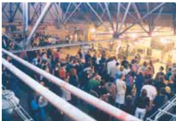
Hudba k 9. 9. 99