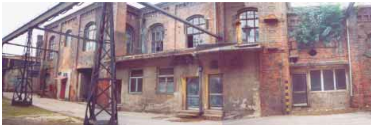
Fasáda šaten bývalé slévárny (budoucí Salon Vaňkovka)