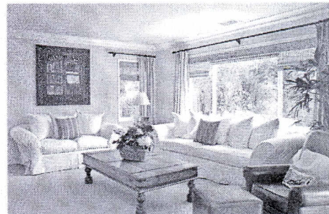
гостиная obývací pokoj

В гостиной мы отдыхаем, смотрим телевизор, принимаем гостей, отмечаем праздники. Это самая большая комната. Там стоит большой диван, кресла и журнальный столик. Напротив дивана расположены телевизор и музыкальный центр. На полу лежит ковёр. У стены стоит комбинированный шкаф. За стеклянными дверцами хранится праздничная посуда. В гостиной много комнатных цветов. В углу стоит аквариум, в котором плавают разноцветные рыбки. Кормить рыбок и чистить аквариум – это моя обязанность. За цветами ухаживает мама, я только иногда их поливаю.