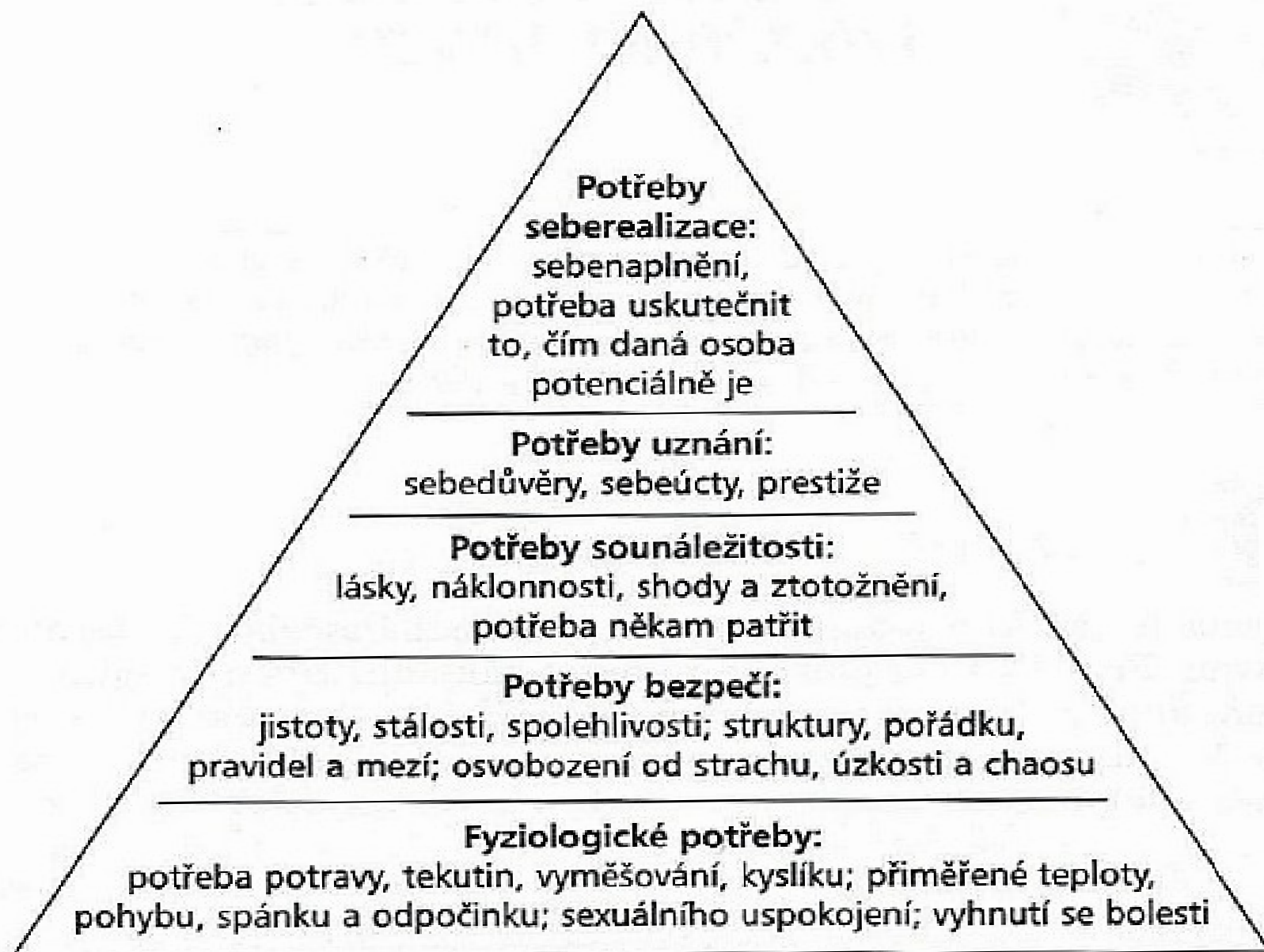
Hierarchie potřeb podle A. Maslowa