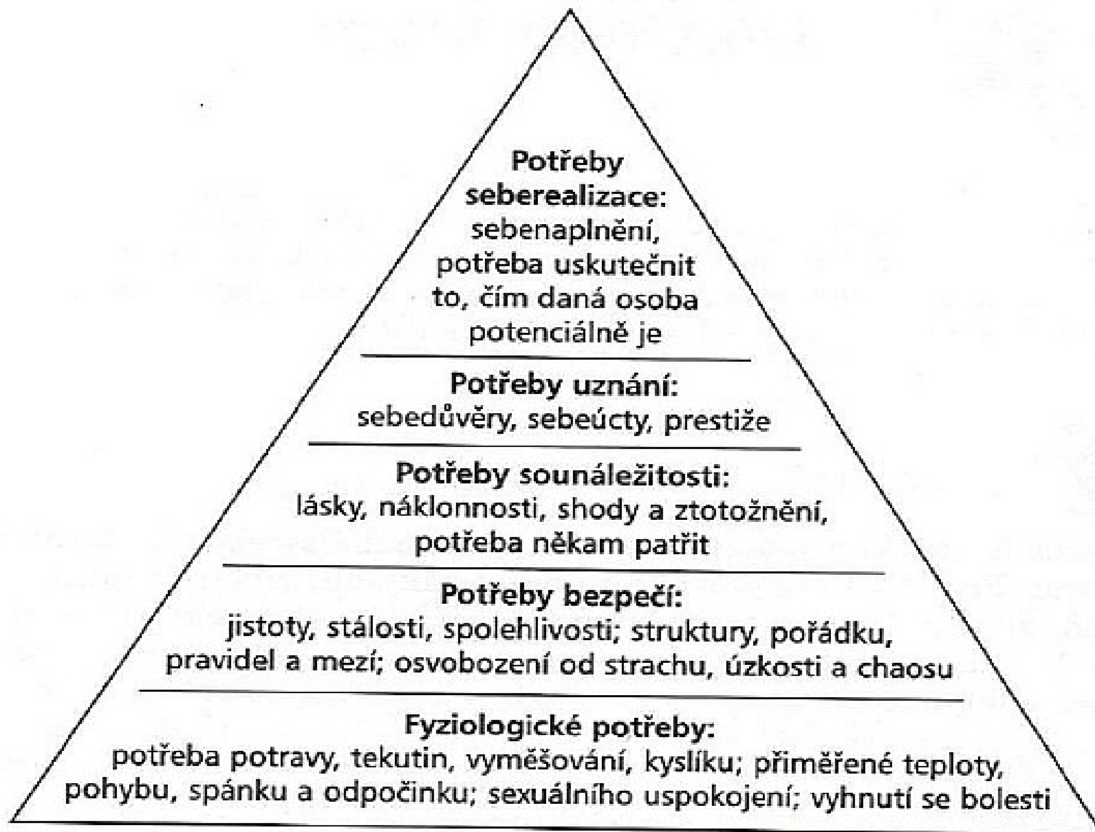
Hierarchie potřeb podle A. Maslowa