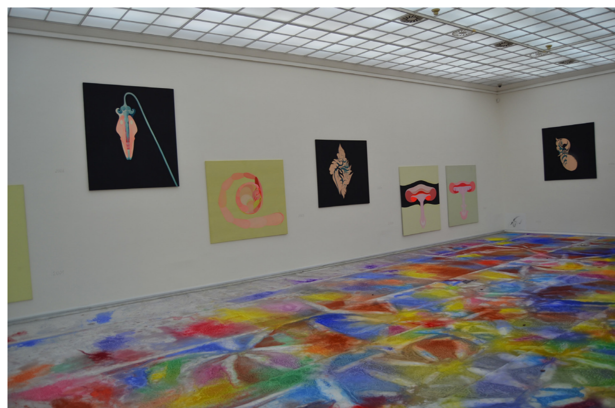
Petr Nikl, Hra o čas (Galerie hlavního města Prahy, Městská knihovna, 2013)

Tyto myšlenky jsem se snažila zreflektovat v teoretické a praktické práci, jejímž fyzickým výstupem je aktivní knížka.