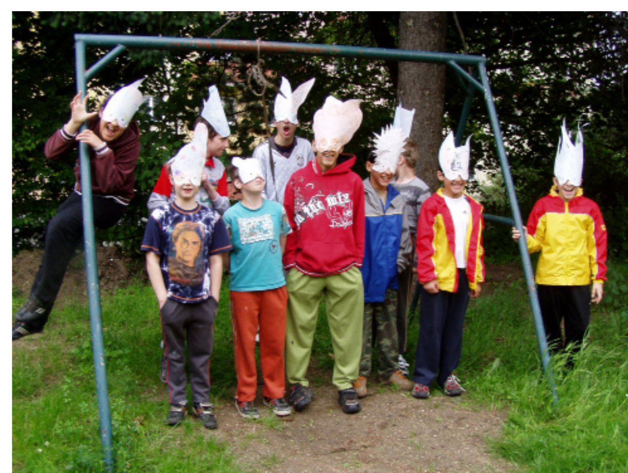
Animace Galerie na cestách za znevýhodněnými skupinami (Dětský domov Vídeňská, Brno, 2010,)