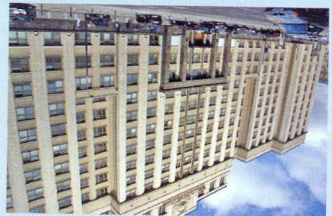
Здание парламента РФ budova ruskeho parlamentu