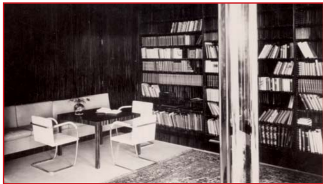
Knihovna hlavního obytného prostoru vily Tugendhat