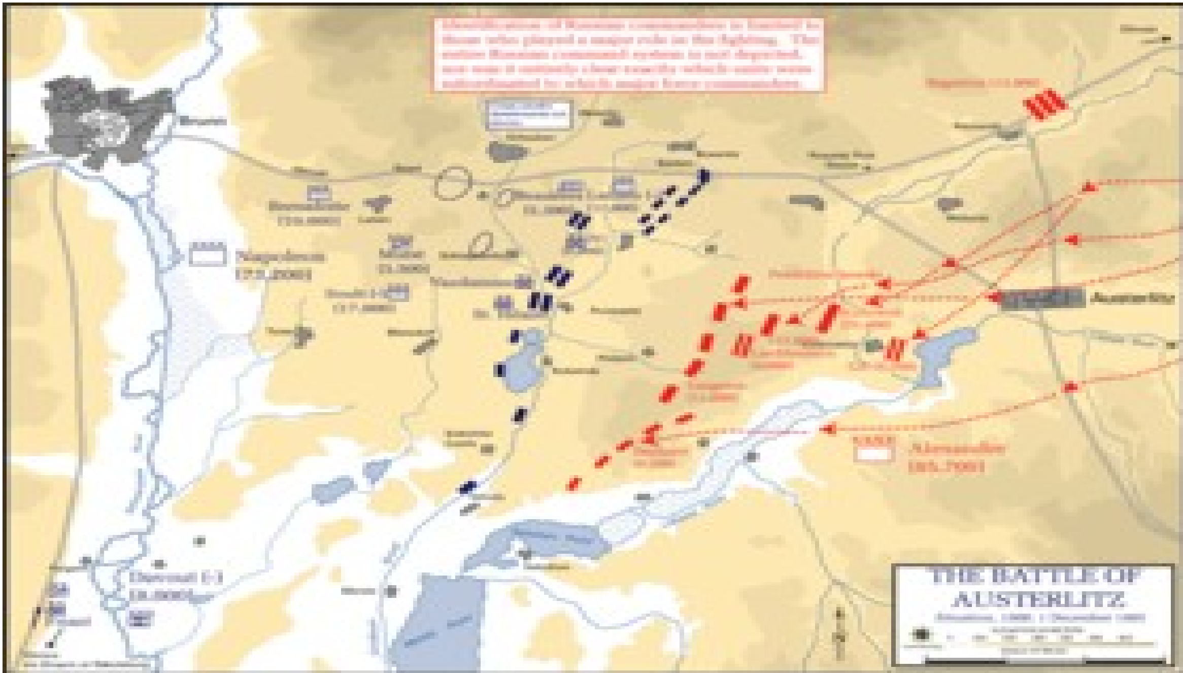
THE BATTLE OF AUSTERLITZ Austrian, 1805, 2 December 1805 Scale: 0 100 200 Kilometers Scale: 0 100 200 Miles

Many pieces of Russian artillery in January in Moscow were played a major role in the fighting. The entire Russian command system is not depicted, nor were it entirely a low priority which units were subordinated to which major force commanders.