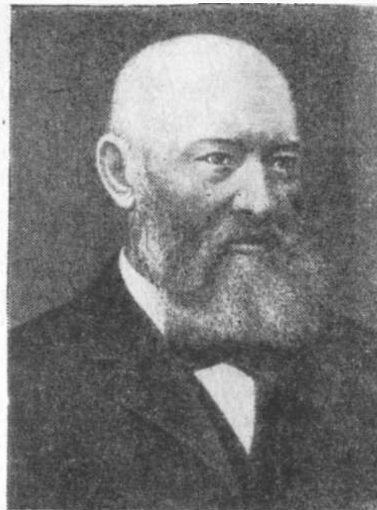
Александр Николаевич Островский.