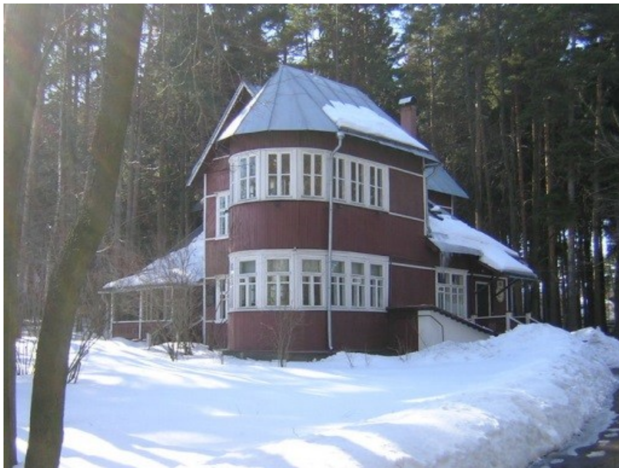
Дача Б. Пастернака в Переделкине.