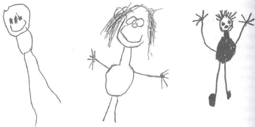
Obrázek č. 5 – Vývoj kresby lidské postavy u chlapce předškolního věku (první kresba je ze 4 let, druhá ze 4 a půl roku a poslední z 5 a čtvrt roku).