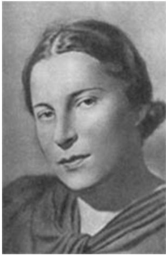
Агния Львовна Барто (1906-1981)