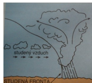
Obrázek 2 Vertikální řez studenou frontou (ilustrace)