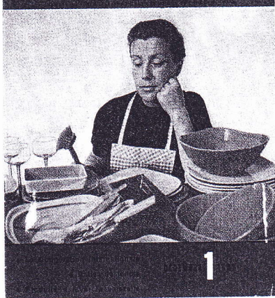
1 er numéro de Que choisir ?