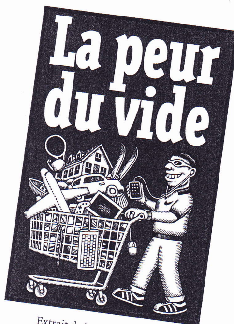
Extrait de la couverture du journal La Décroissance, n° 72, septembre 2010.