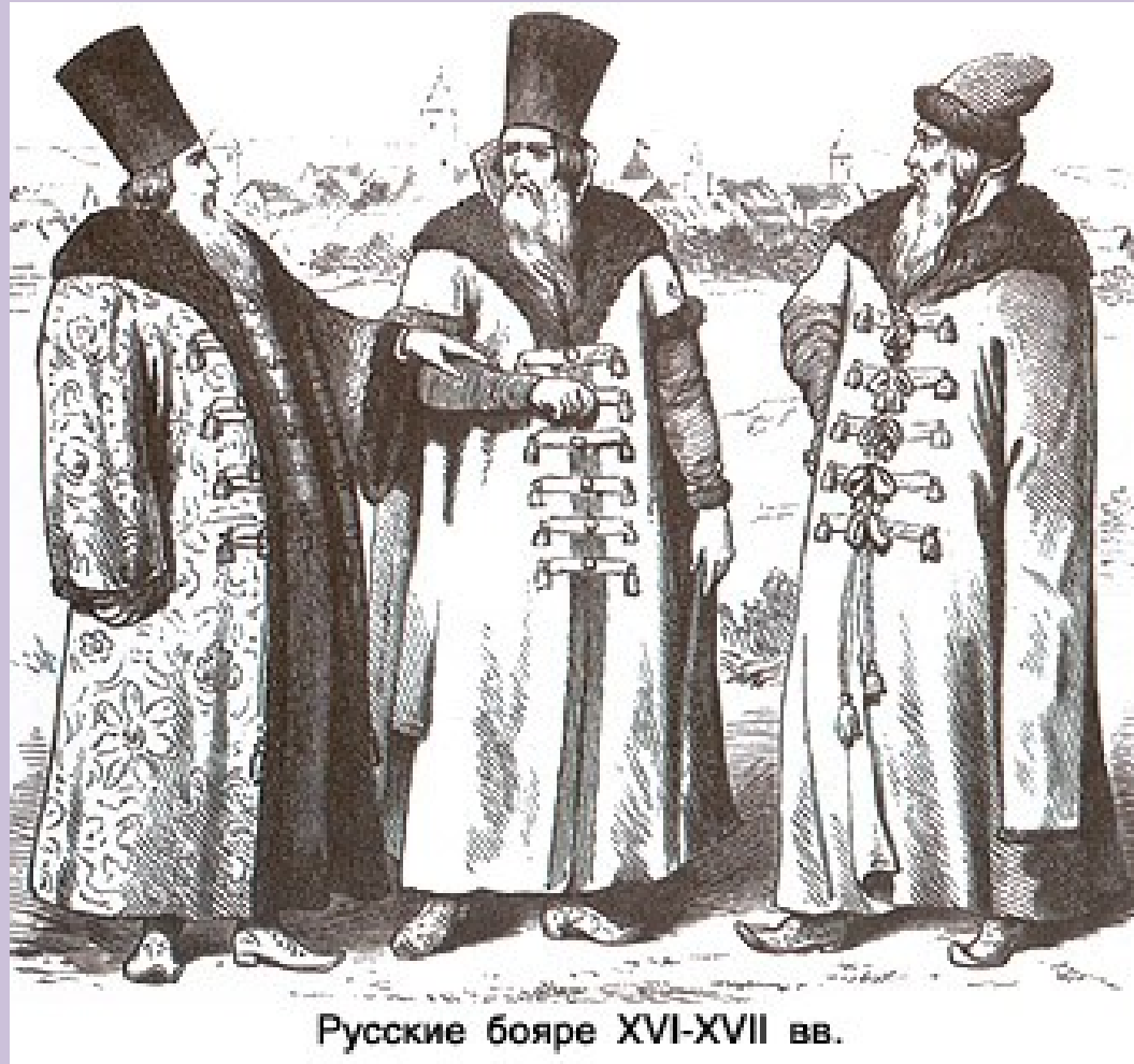
Русские бояре XVI-XVII вв.