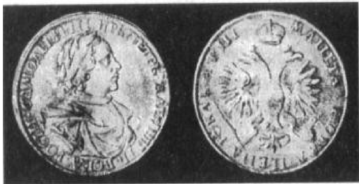
Stříbrný rubl z roku 1718

Důsledek: Rusko na konci Petrovy vlády bylo bez dluhů