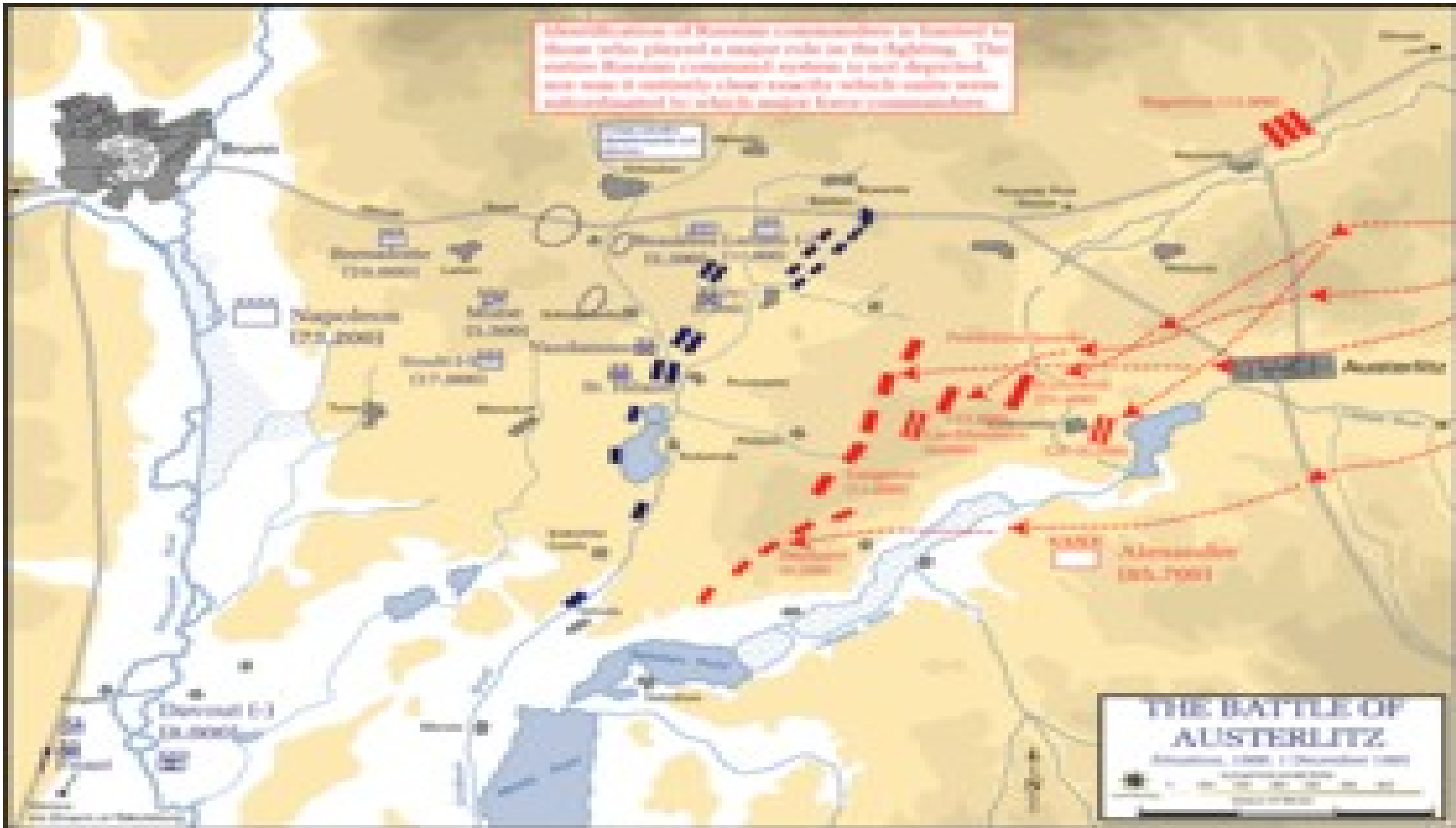
THE BATTLE OF AUSTERLITZ AUGUST 2, 1805 1805

Many pieces of Russian artillery in January in Moscow were played a major role in the fighting. The entire Russian command system is not depicted, nor were it entirely a low priority which units were subordinated to which major force commanders.