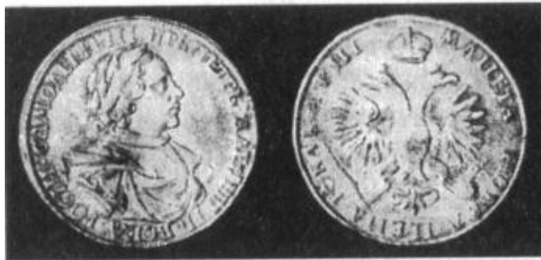
Stříbrný rubl z roku 1718