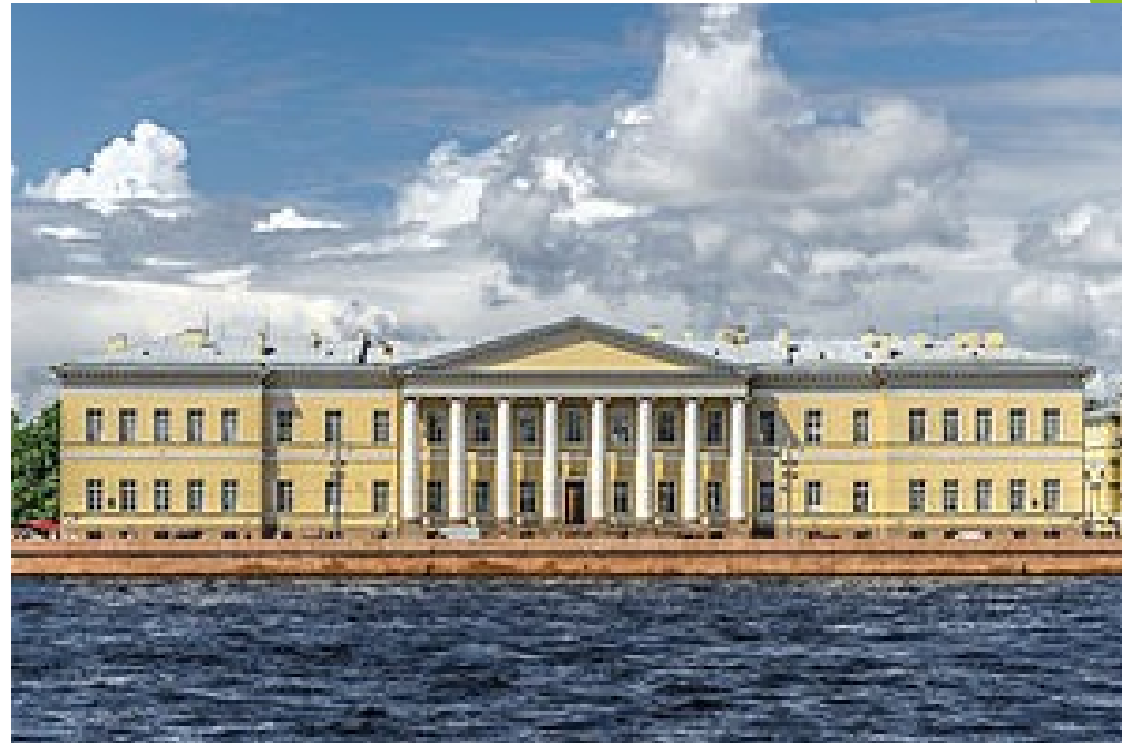
Hlavní budova v Sankt Petěrburgu