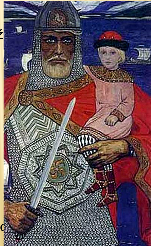
Kníže Oleg se svým synem Igorem