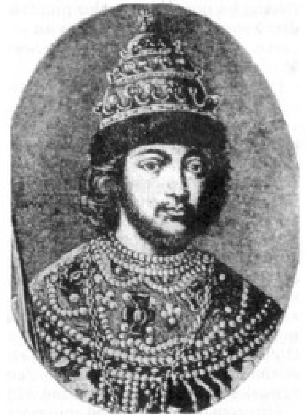
Car Fiodor I.