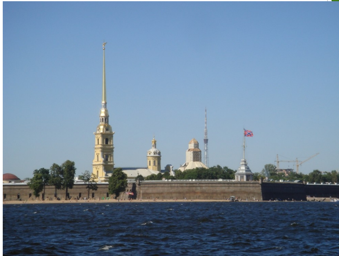
Petropavlovská pevnost ( пость) ↑