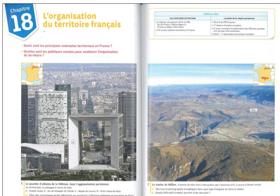
Obr. 1: Úvodní část kapitoly k obyvatelstvu a sídlům francouzské učebnice nakladatelství Hachette.

Figure 1: The opening part of chapter relating to population and settlements of French textbook, Hachette publishing.