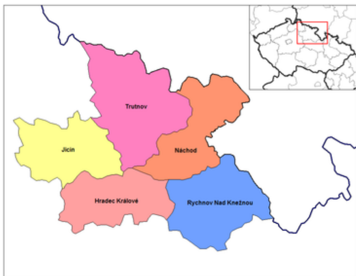
Obr. 2: Okresy a okresní města v Královéhradeckém kraji