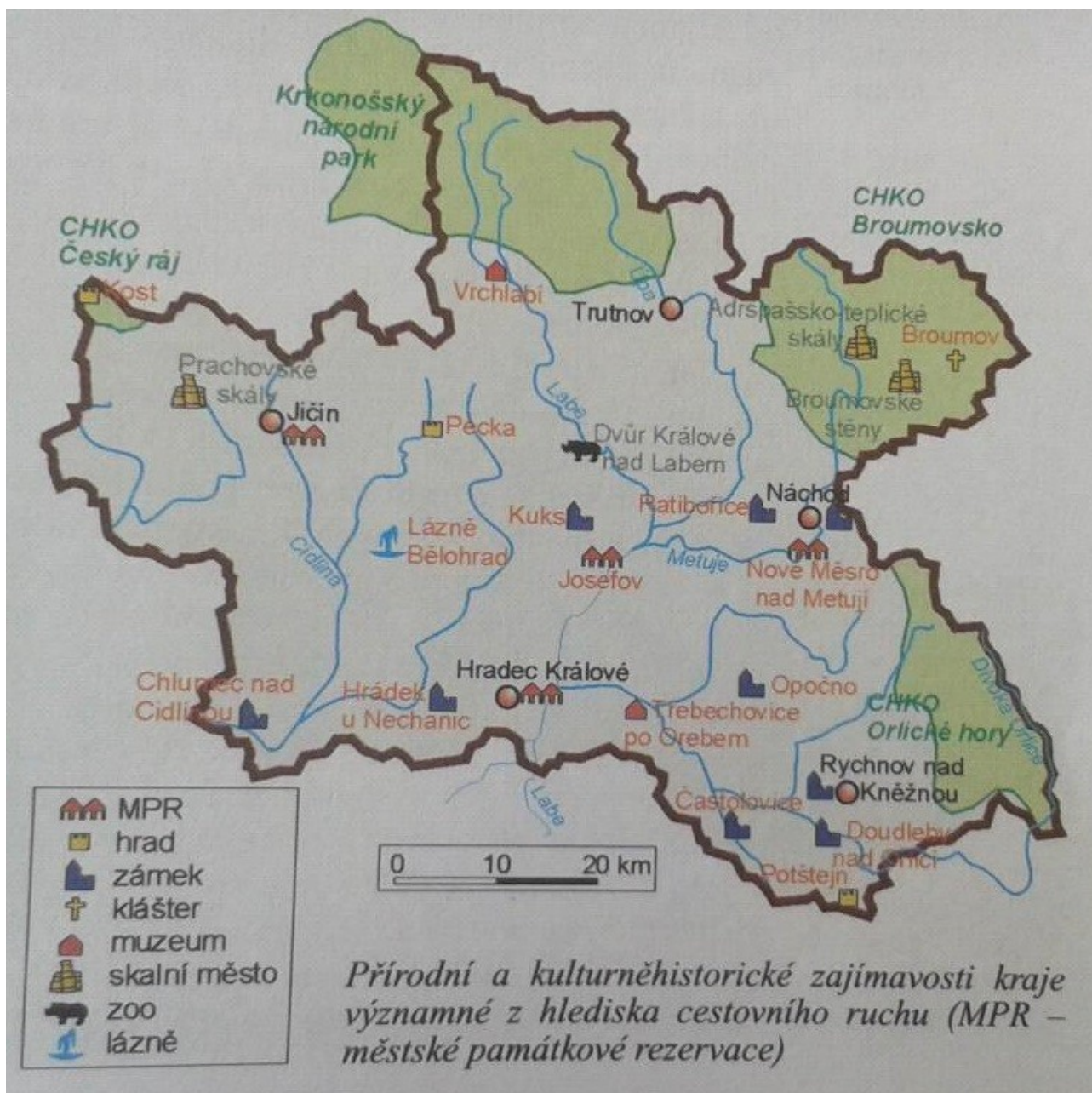
Obr. 4: Přírodní a kulturněhistorické zajímavosti kraje