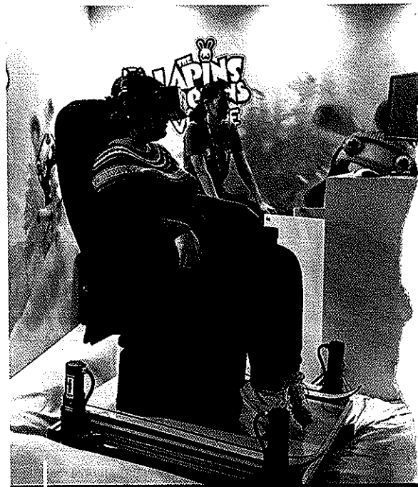
Ci-dessus, Les Lapins Crétins , stars du studio français Ubisoft. Above, Raving Rabbits , the stars of the French Ubisoft studios.

industrie n'est plus aussi masculine et propose des jeux plus adaptés aux femmes, mais aussi aux familles », ajoute-t-il. D'autant que les enfants des années 1980, nés avec ce loisir, ne l'ont pas abandonné, bien au