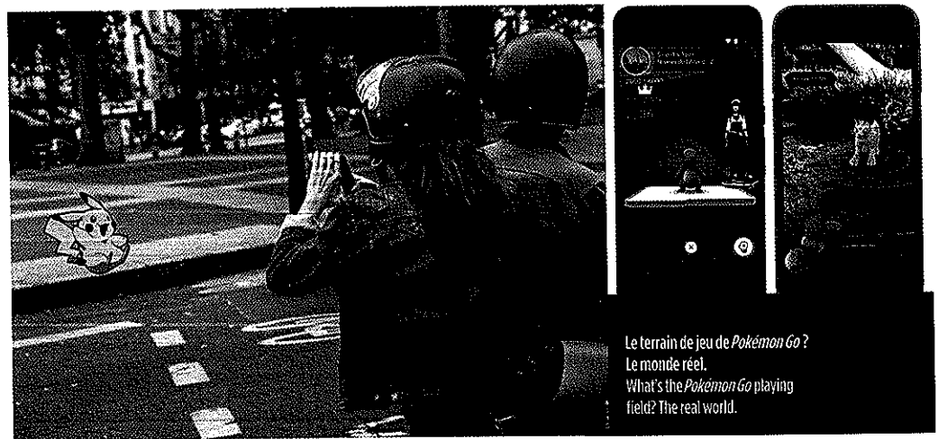
Le terrain de jeu de Pokémon Go ? Le monde réel. What's the Pokémon Go playing field? The real world.