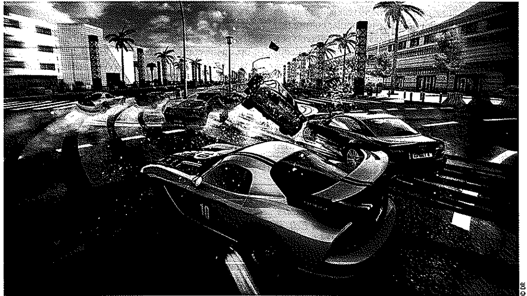
Asphalt 8: Airborne, jeu de course à télécharger, édité par le Français Gameloft. Asphalt 8: Airborne, a downloadable racing game developed by the French company Gameloft.