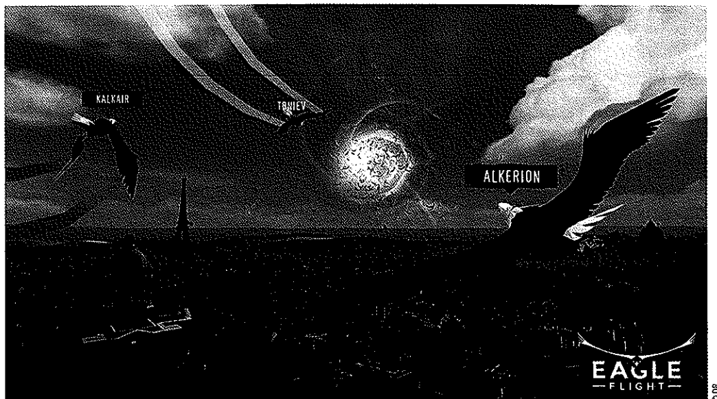
Eagle Flight de Ubisoft, pour voler au-dessus de Paris dans la peau d'un aigle. Ubisoft's Eagle Flight lets you fly over Paris as an eagle.