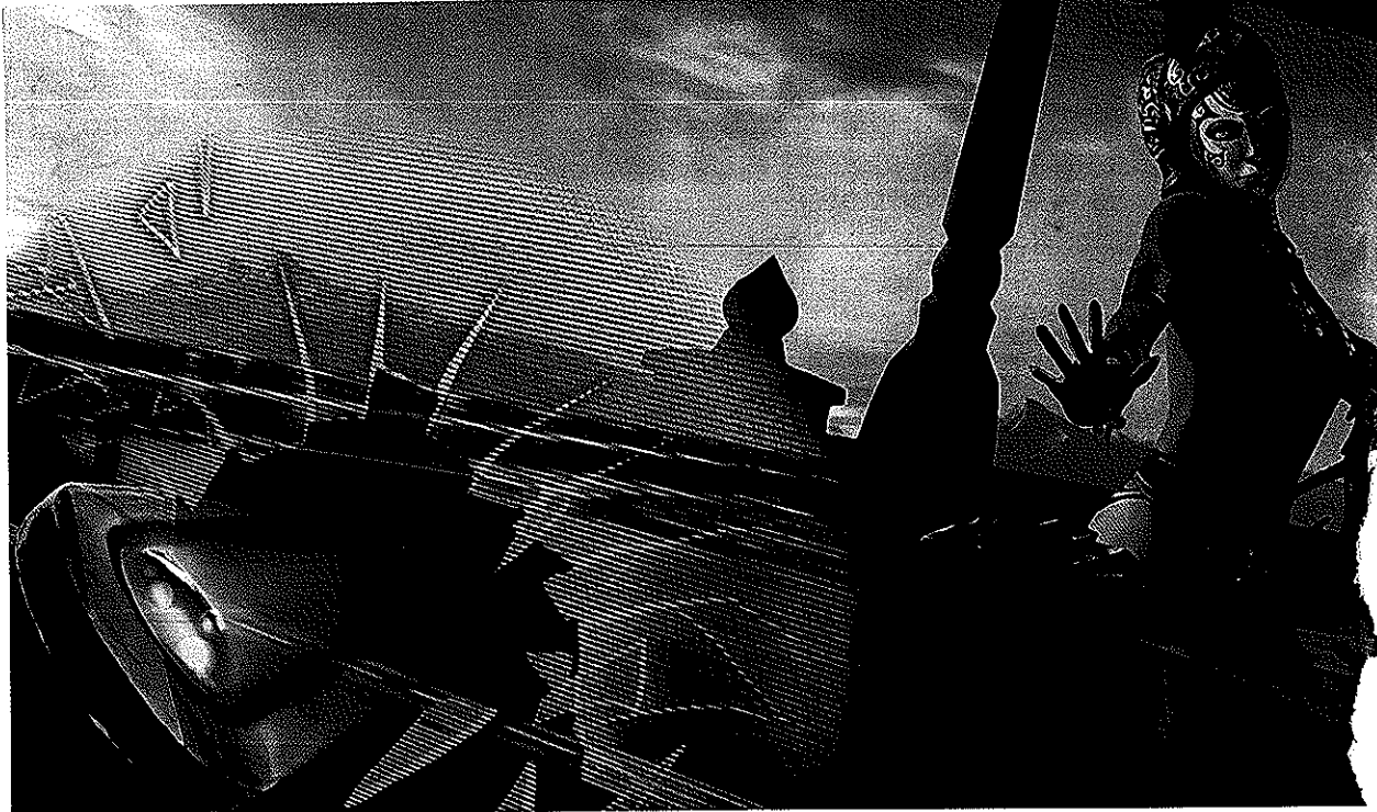
Shufflepuck Cantina est développé par le studio lyonnais Agharta. Shufflepuck Cantina developed by Agharta Studio in Lyon.