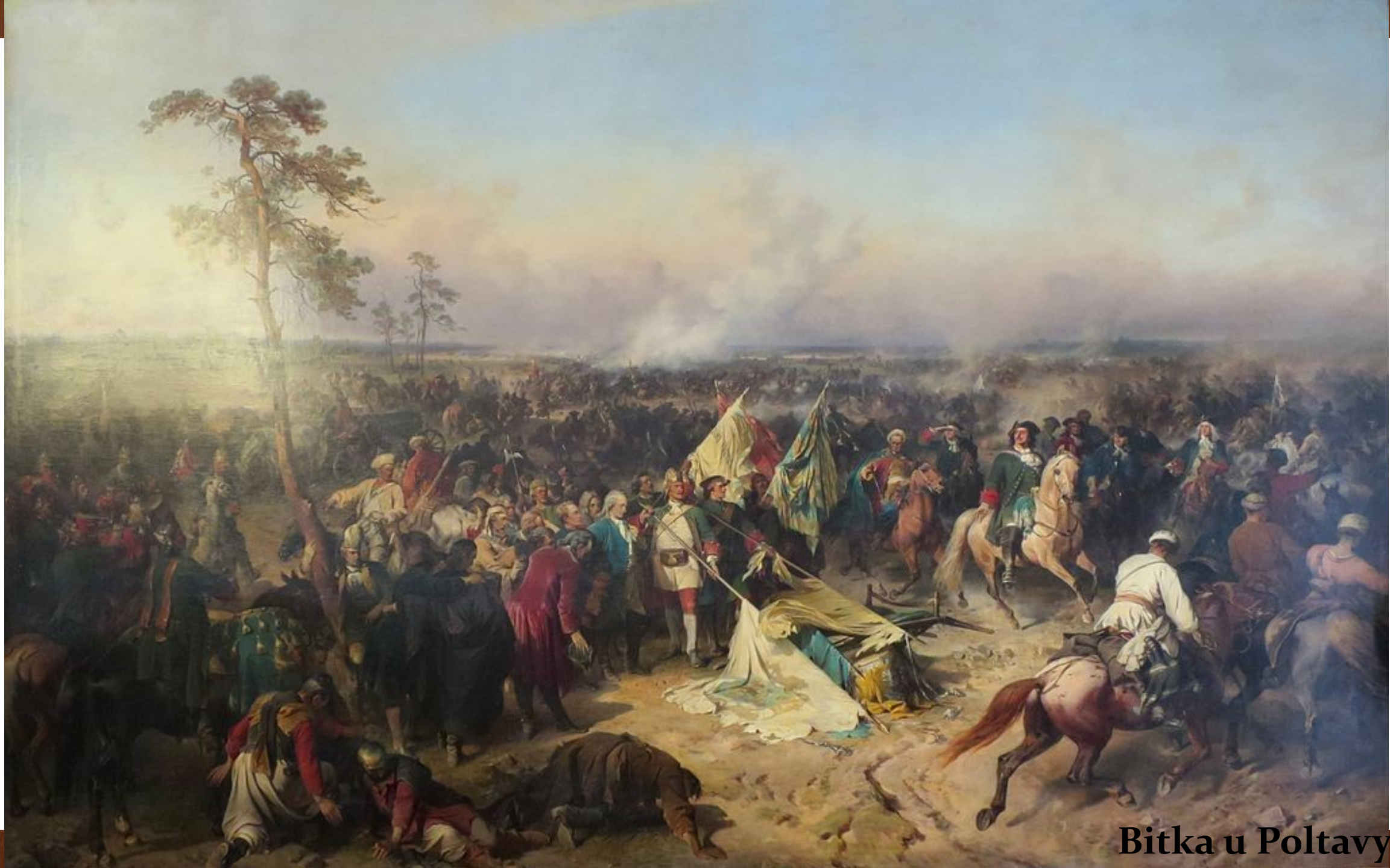
Bitka u Poltavy