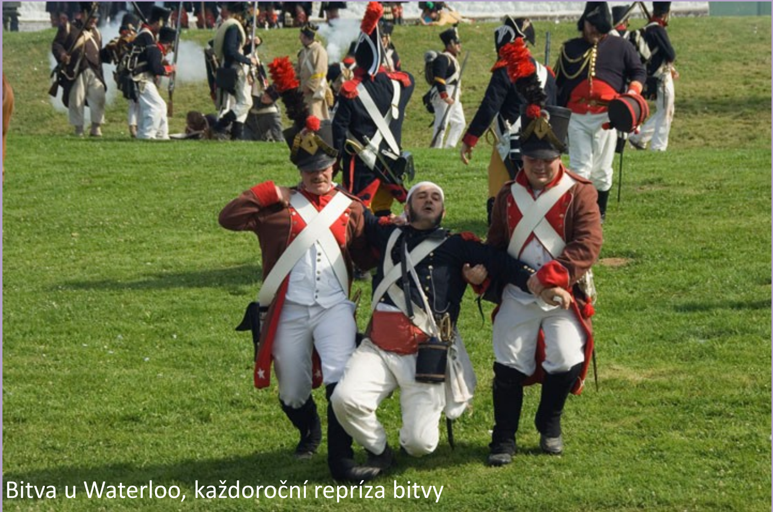
Bitva u Waterloo, každoroční repríza bitvy

http://www.tyden.cz/obrazek/4a8bfab3372d4/alamy-ak4wry-4a8c0dd74a12d.jpg