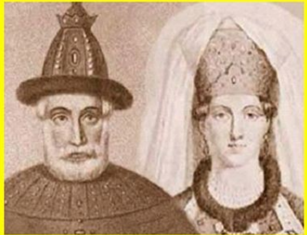
Василий III и Елена Глинская