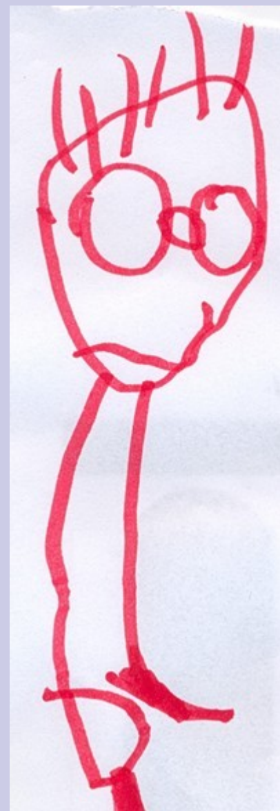
4roky 5 měs.