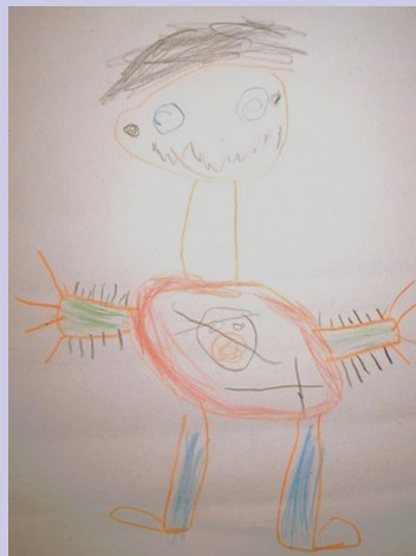
Chlapec 5 let