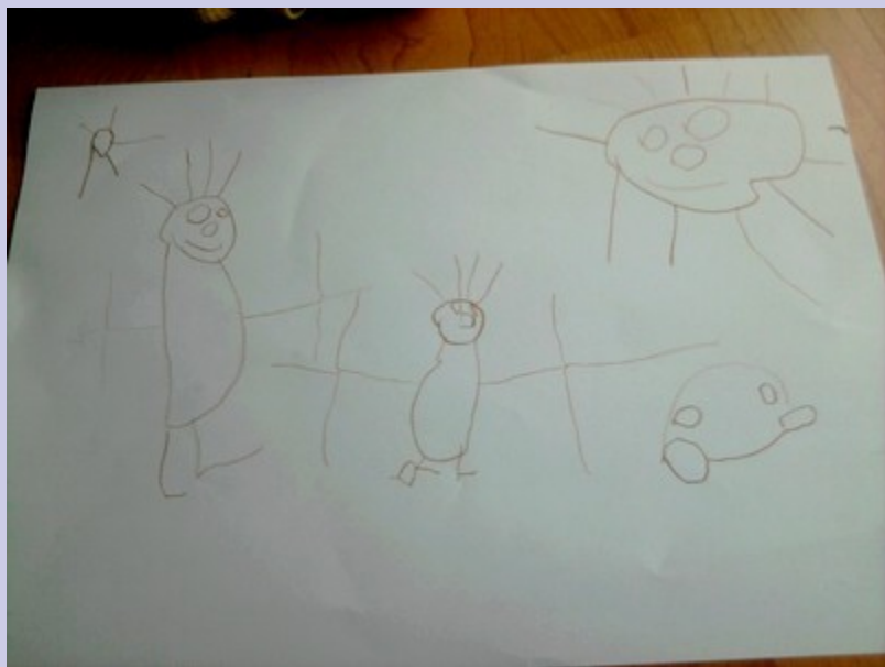
Já a bráška Kubíček 2 roky