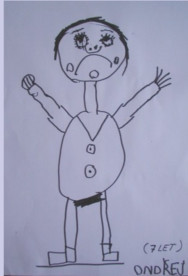
(7 LET) ONDŘEJ