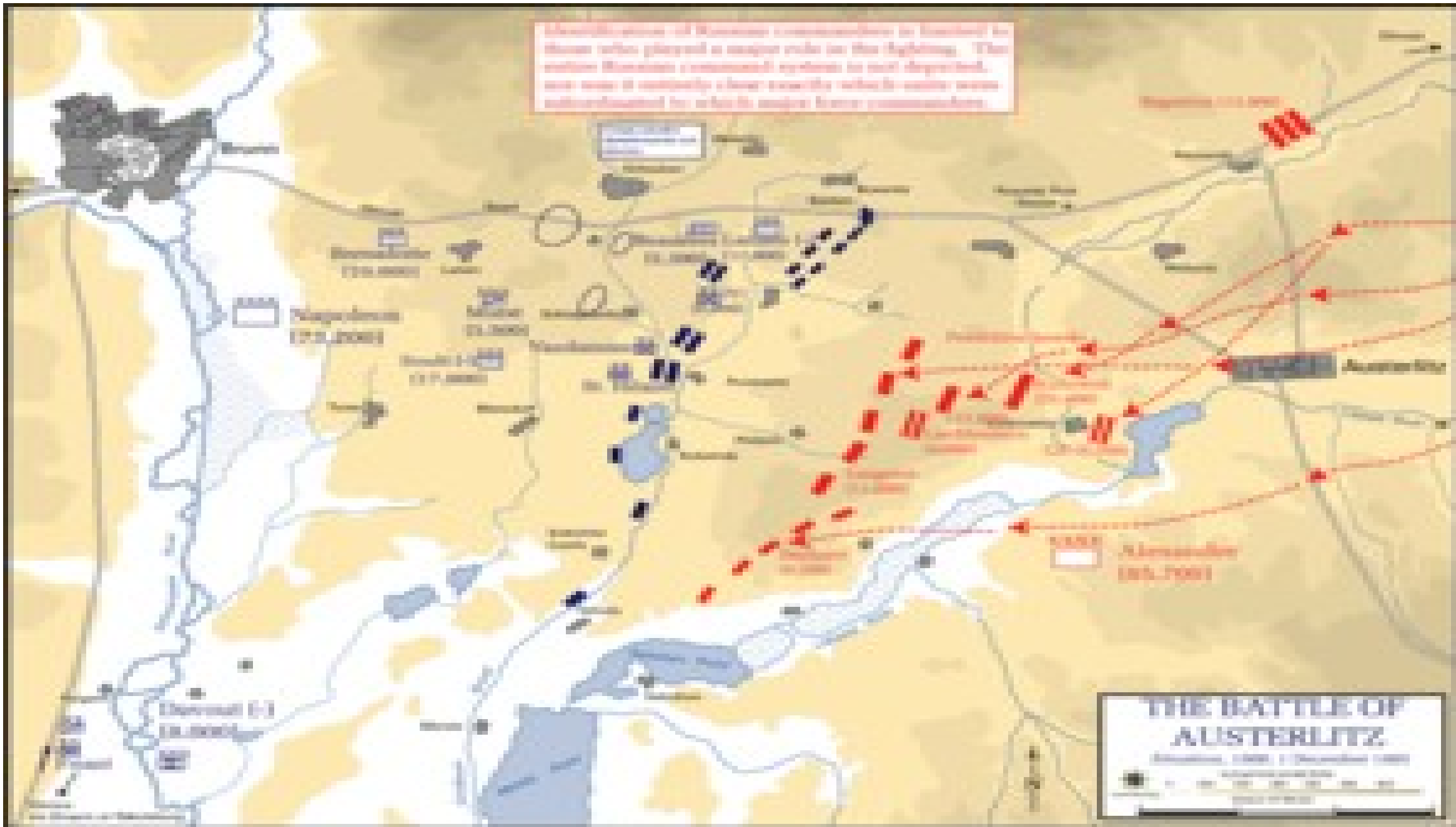
THE BATTLE OF AUSTERLITZ Austrian, 1805, 2 December 1805 Scale: 1:100,000

Many pieces of Russian artillery in January in Moscow were played a major role in the fighting. The entire Russian command system is not depicted, nor were it entirely a low priority which units were subordinated to which major force commanders.