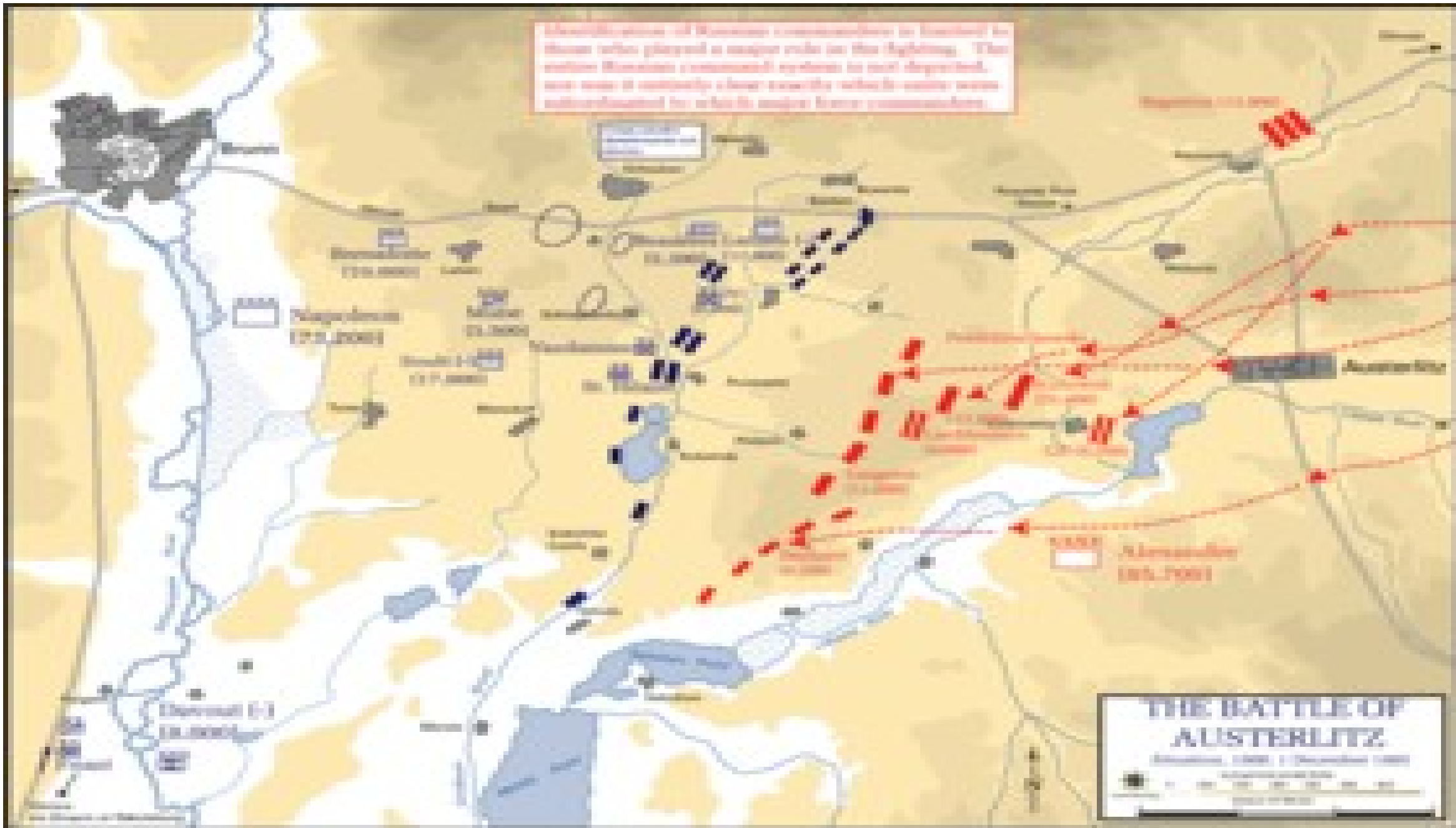
THE BATTLE OF AUSTERLITZ November 19th & 20th December 1805 Austrian, Russian, French, British, Prussian, Spanish, Sardinian, Swedish, Turkish, Venetian, and other forces. Scale: 0 20 40 60 80 100 Kilometers

Many pieces of Russian artillery in January in Moscow were played a major role in the fighting. The entire Russian command system is not depicted, nor were it entirely a low priority which units were subordinated by which major force commanders.