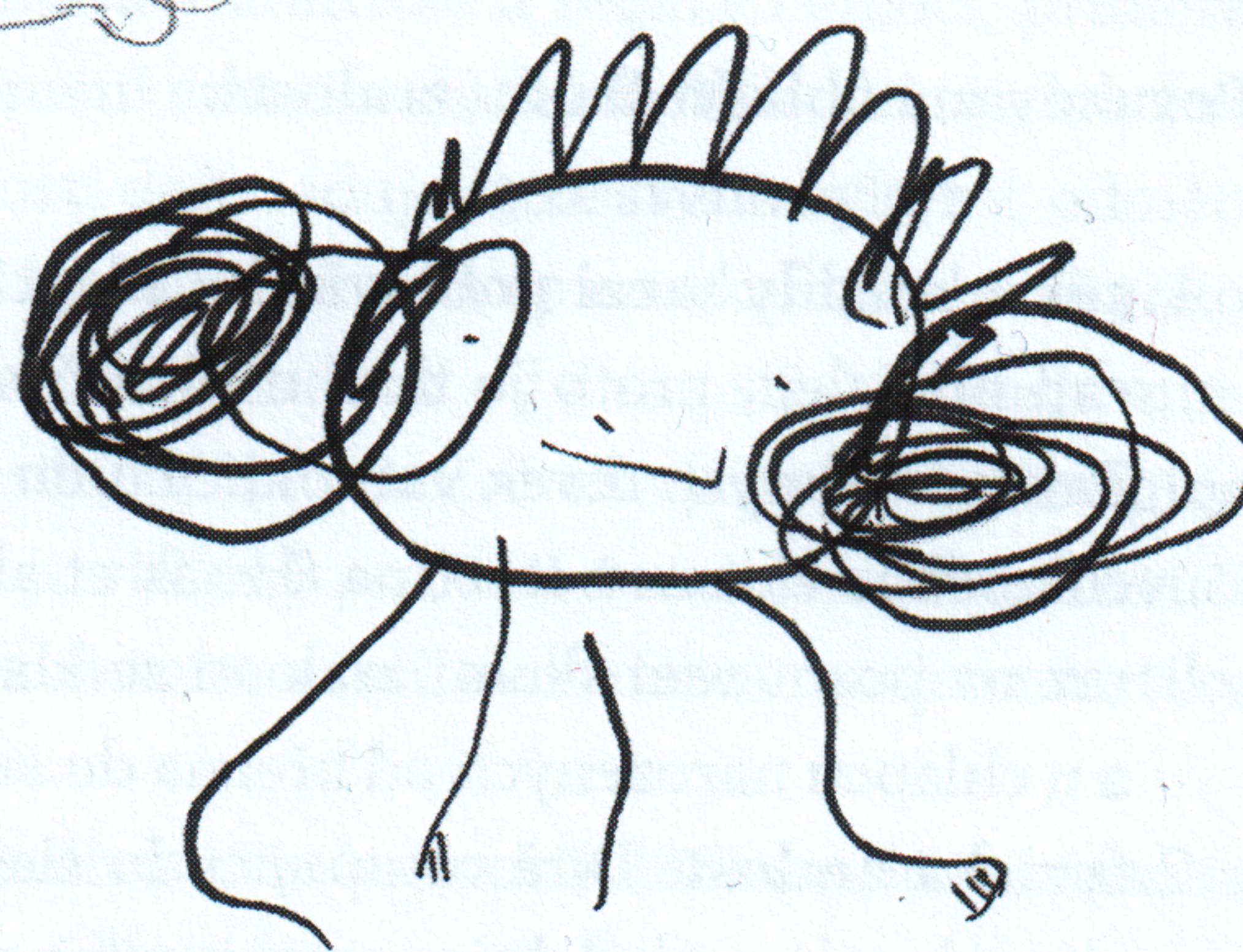
Kresba postavy dítěte s lehkým mentálním opožděním.