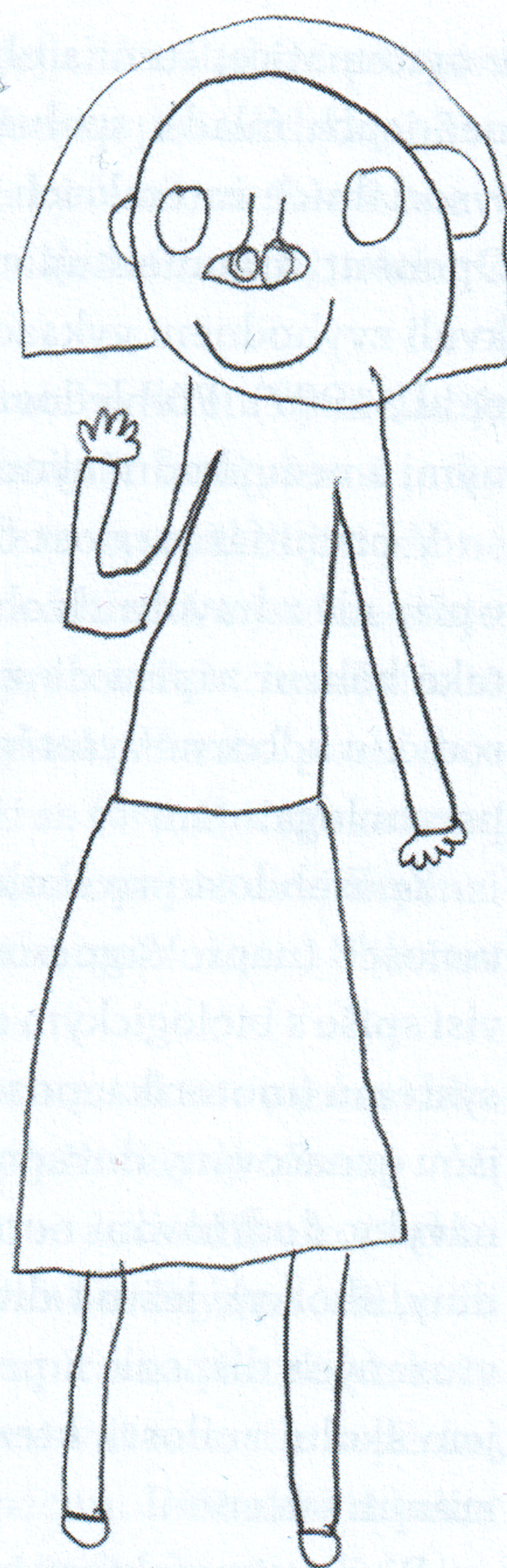
Zralá dívčí kresba.