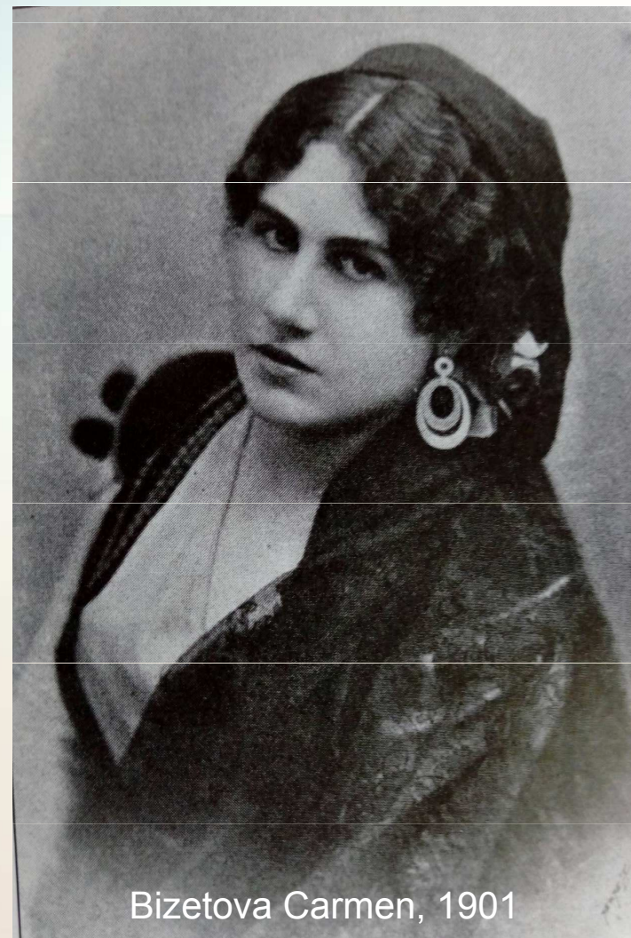
Bizetova Carmen, 1901