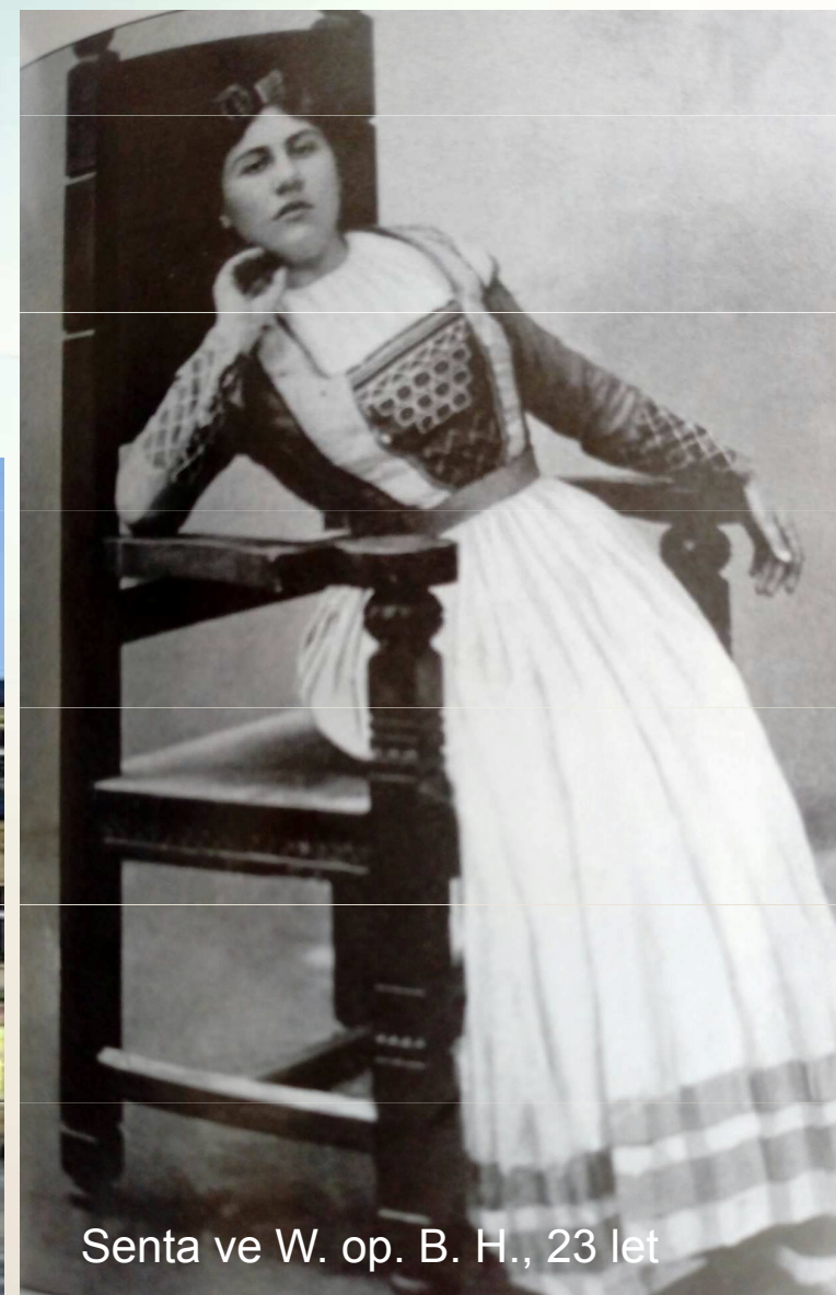
Senta ve W. op. B. H., 23 let