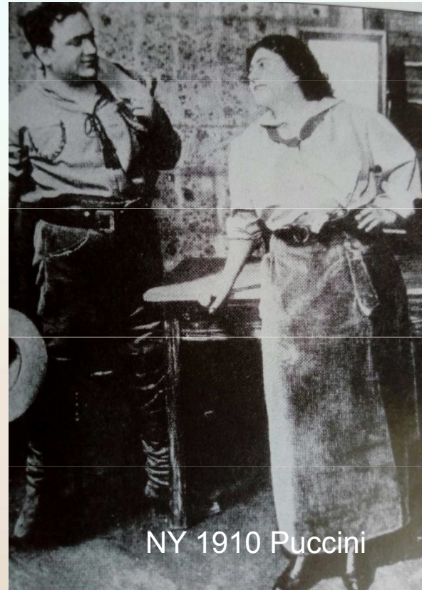
NY 1910 Puccini