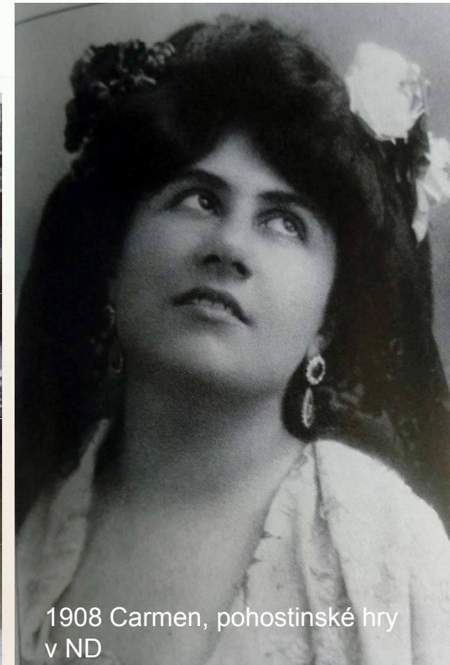
1908 Carmen, pohostinské hry v ND