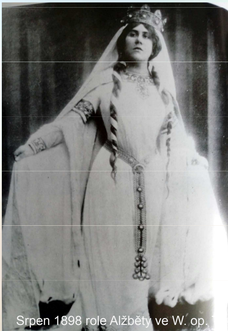
Srpen 1898 role Alžběty ve W. op.