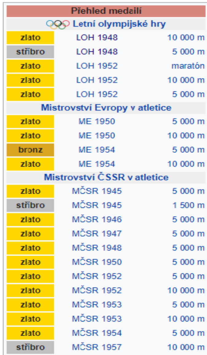
Medaile Emila Zátopka