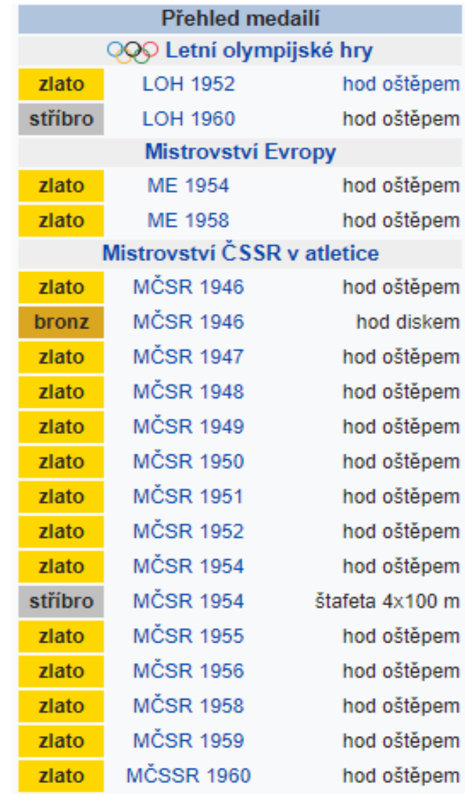
Medaile Dany Zátopkové