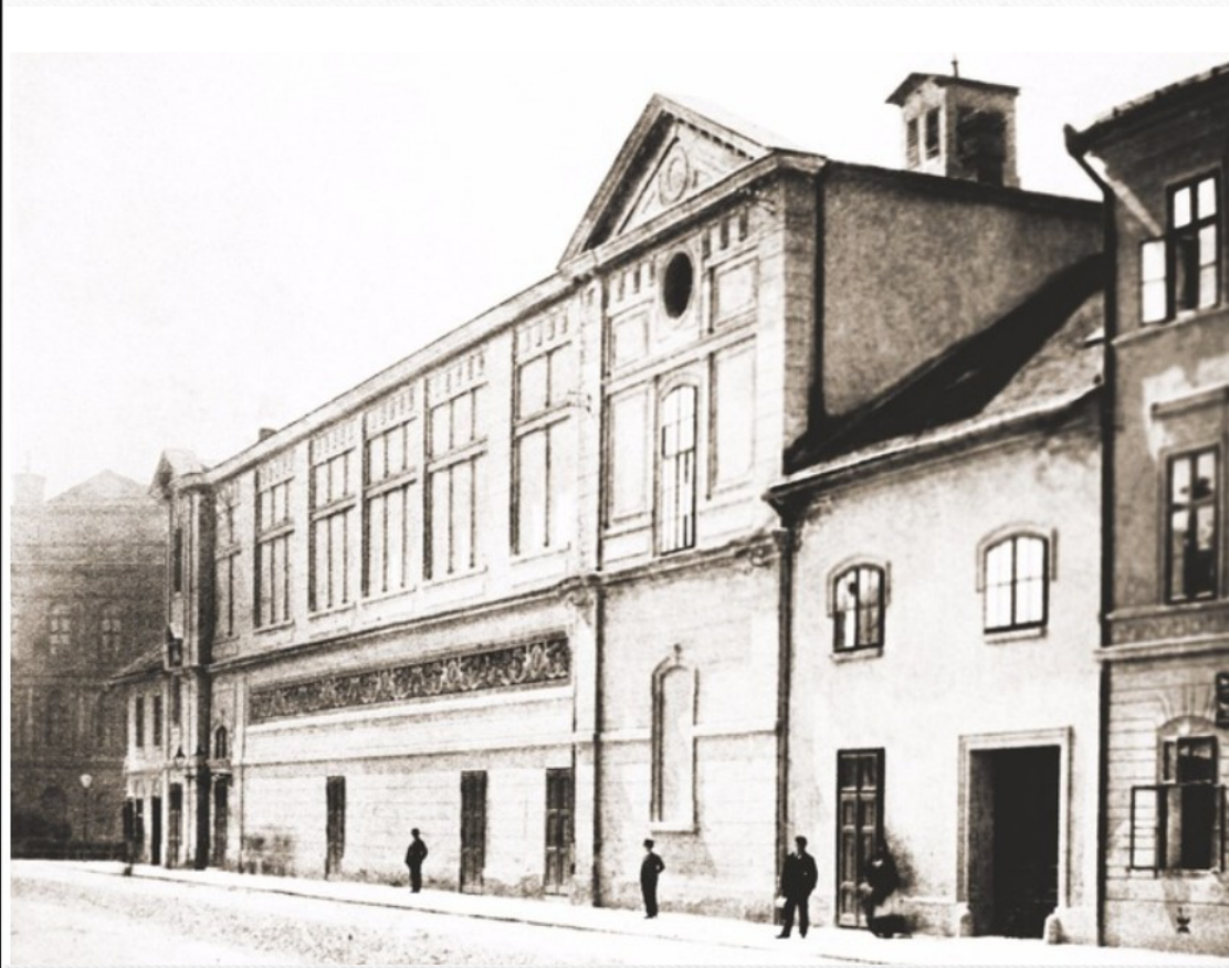
Brno. Dívčí ústav „Vesna“.