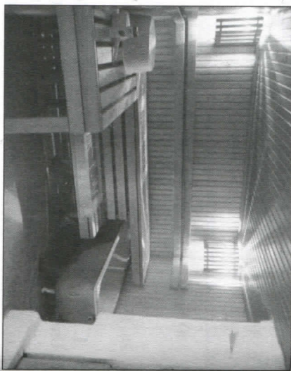
Традиционная русская баня

В каждом уголке России, в каждой семье существуют особенные правила мытья. Однако есть общий, немаловажный момент: стремление превратить процесс парения в бане не только в простое мытьё, но в лечебную процедуру, оказывающую успокоение и душе, и телу.