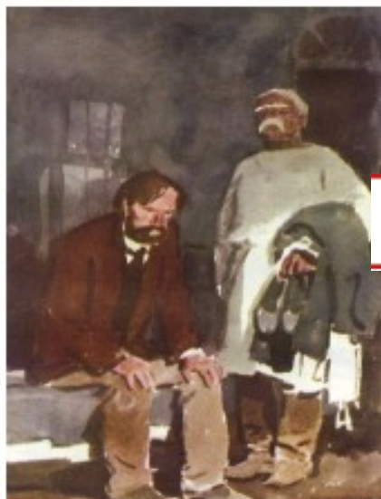
«ПАЛАТА № 6»

о том, как жили душевнобольные в больнице.