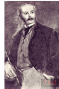
Павел Петрович КИРСАНОВ

Любовные чувства – «романтическая чепуха». Искусство – извращение и чепуха. «Природа не храм, а мастерская, и человек в ней – работник».