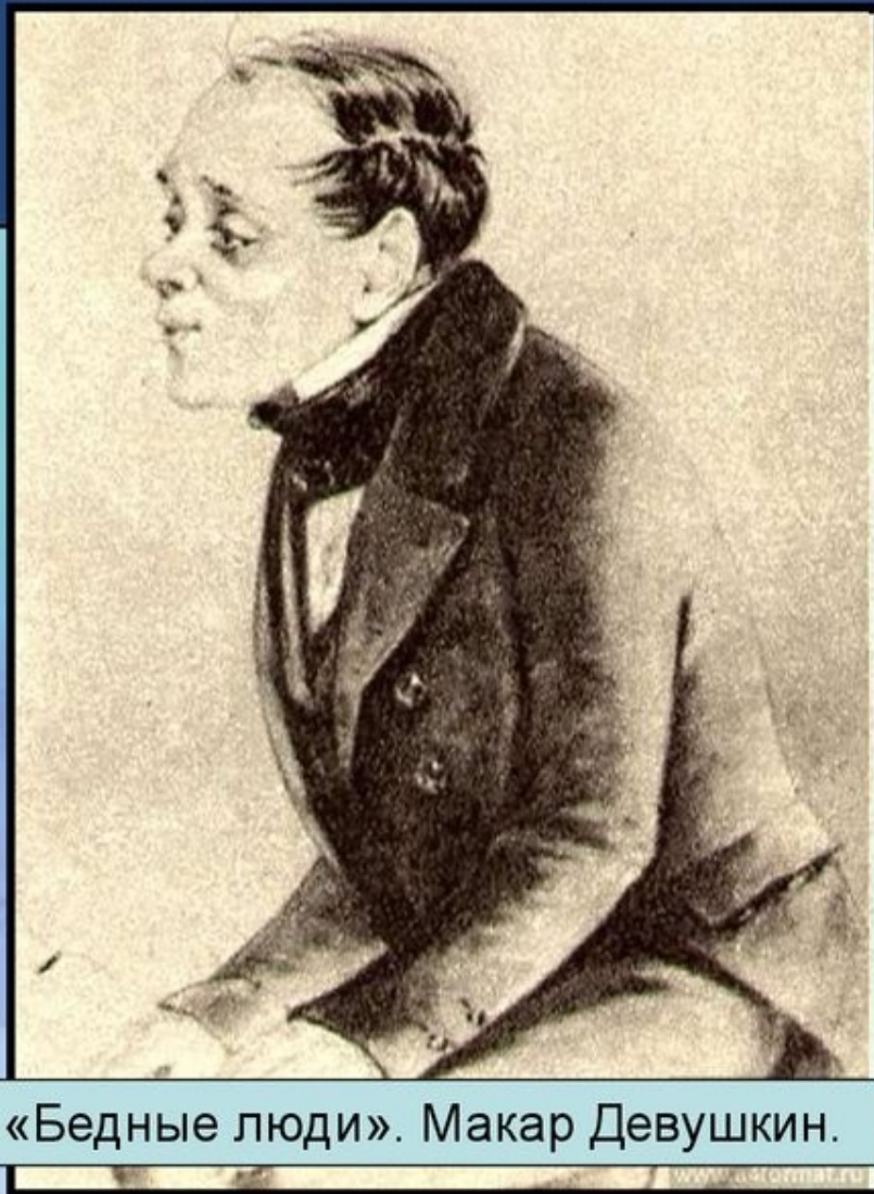
«Бедные люди». Макар Девушкин.