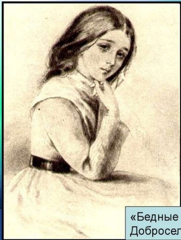
«Бедные люди». Варенька Доброселова